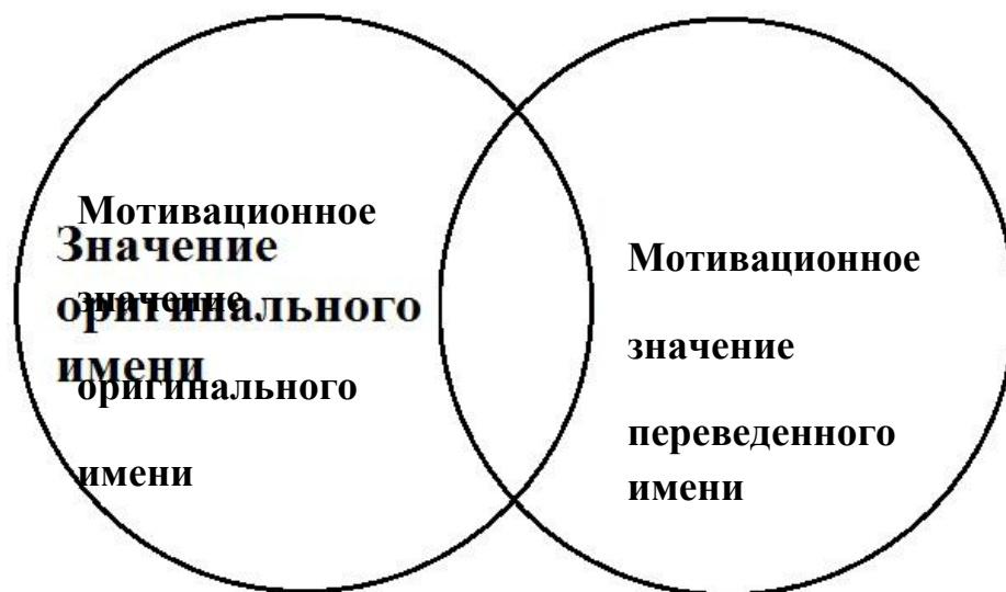
Рисунок 2. Калькирование