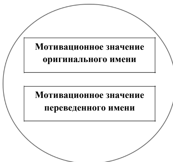
Рисунок 3. Калькирование

На рисунке 1 видно, что при использовании метода транслитерации/транскрипции значения оригинальных и переведенных имен абсолютно не совпадают. В качестве примера можно привести следующие случаи – Purity (оригинальное имя) и Пьюрити (официальный перевод), Ardent (оригинальное имя) и Ардент (Nika Hagen).