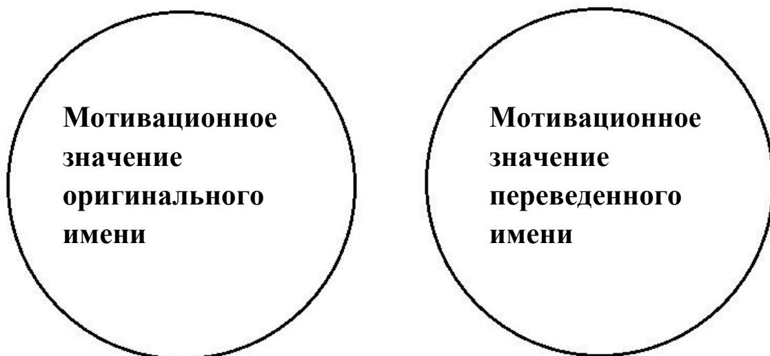
Рисунок 1. Транслитерация/транскрипция

При передаче имен собственных на русский язык переводчик пользовались двумя методами – калькирование и транслитерация/транскрипция. При использовании метода транслитерации/транскрипции имя собственное может потерять свое значение. Зависимость сохранения оригинального значения имени от используемого метода показана на рисунках 1, 2 и 3.