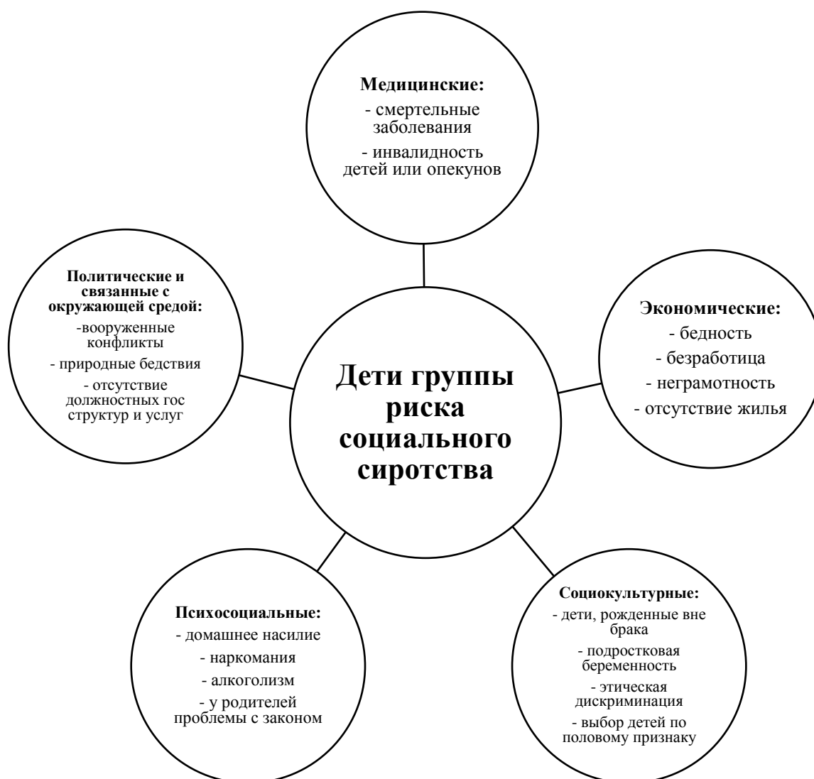
Рис. 1. Факторы риска социального сиротства

- в семье много детей и семья с трудом заботятся о таком количестве детей.