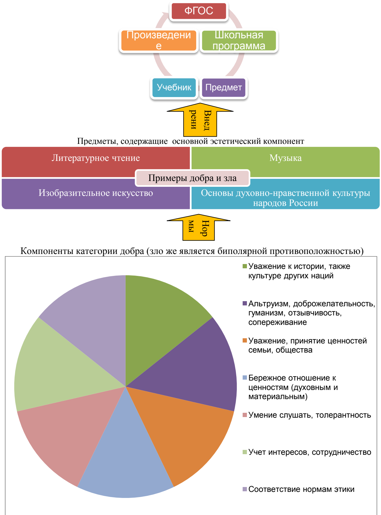
Рис. № 1. Циклический порядок развития представлений о добре и зле