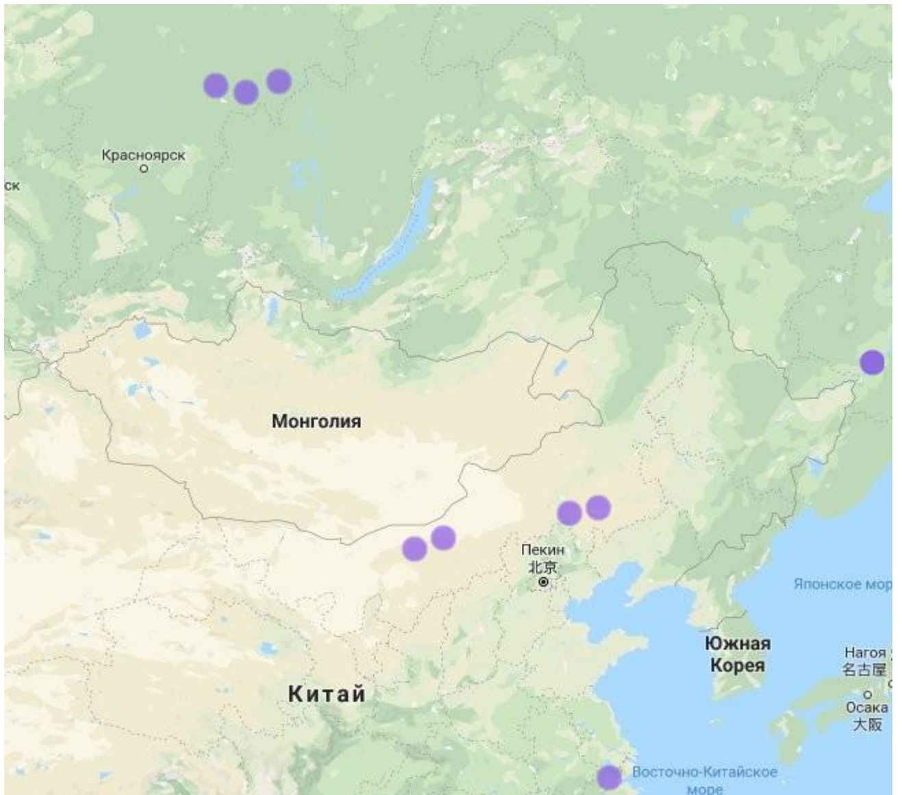
Приложение Б. Локация изображений антропоморфных личин «каменского» типа на территории России и Китая