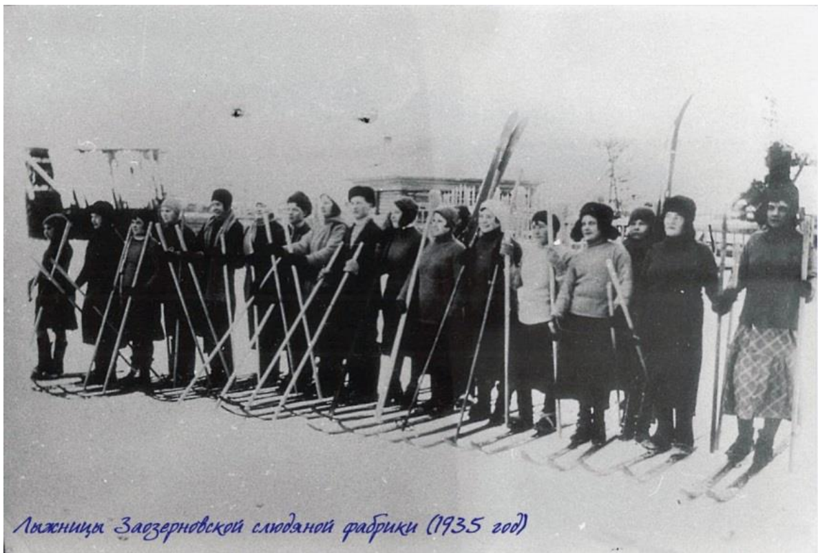
Лыжницы Заозерновской слюдяной фабрики (1935 год)