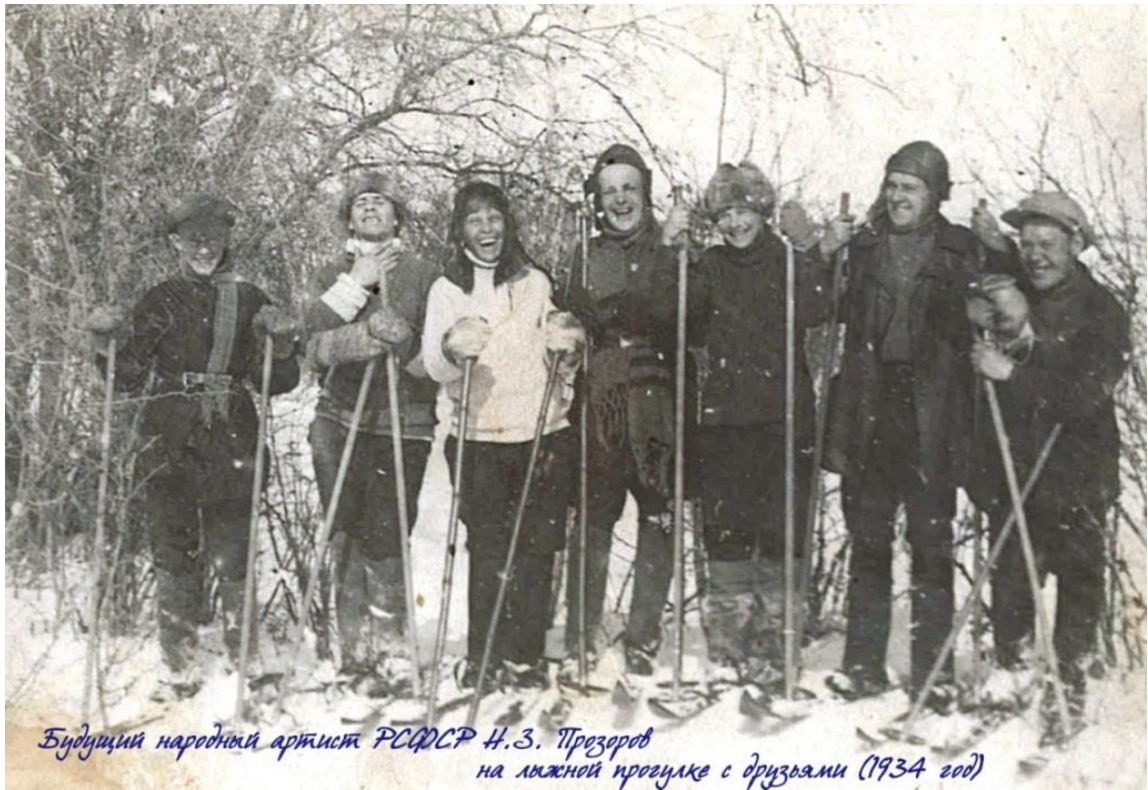
Будущий народный артист РСФСР Н.З. Прозоров на лыжной прогулке с друзьями (1934 год)