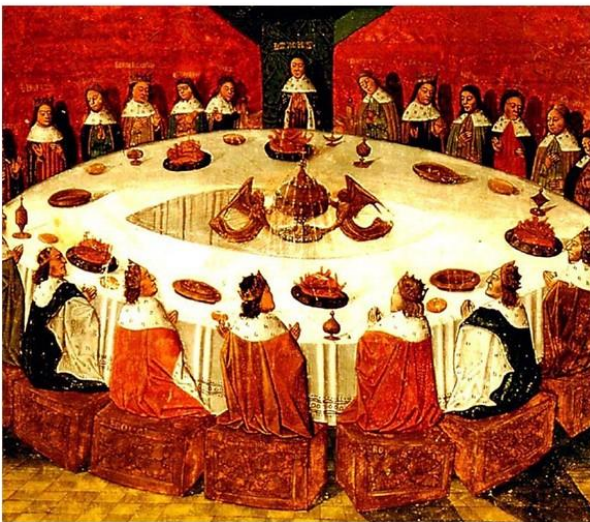
Короля Артура и его рыцарей за круглым столом