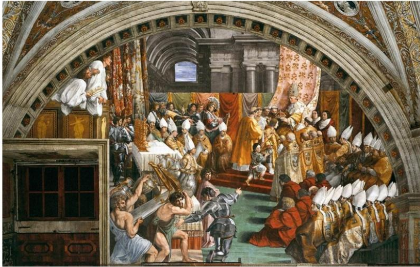
Коронация Карла Великого папой Львом III