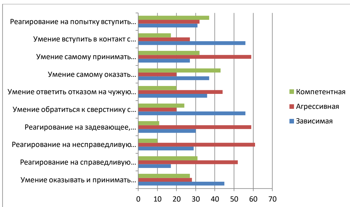
Рис. 3 График процентного соотношения ответов по методике «Тест коммуникативных умений» Л. Михельсона

По данным исследования, коммуникативные навыки подростки проявляют больше всего в ситуации поддержки сверстников и в реагировании на попытку вступить с ними в контакт. В ситуациях получения критики – справедливой и несправедливой, подростки реагируют остро, высокие показатели у агрессивной и зависимой позиции в общении.