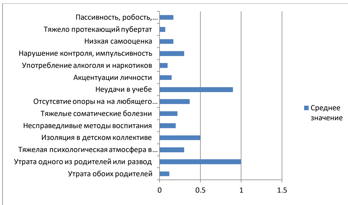
Рис. 2. График показателей по методике «Прогностическая таблица риска суицида у детей и подростков», А. Н. Волкова

Значительную выраженность в среднем по группе получили факторы «Отсутствие опоры на взрослого» (0,37), «Утрата одного из родителей, развод» (1). При этом самые низкие значения у группы респондентов занимают шкалы «Употребление алкоголя, наркотиков» (0,1), «Несправедливые методы воспитания в семье» (0,2).