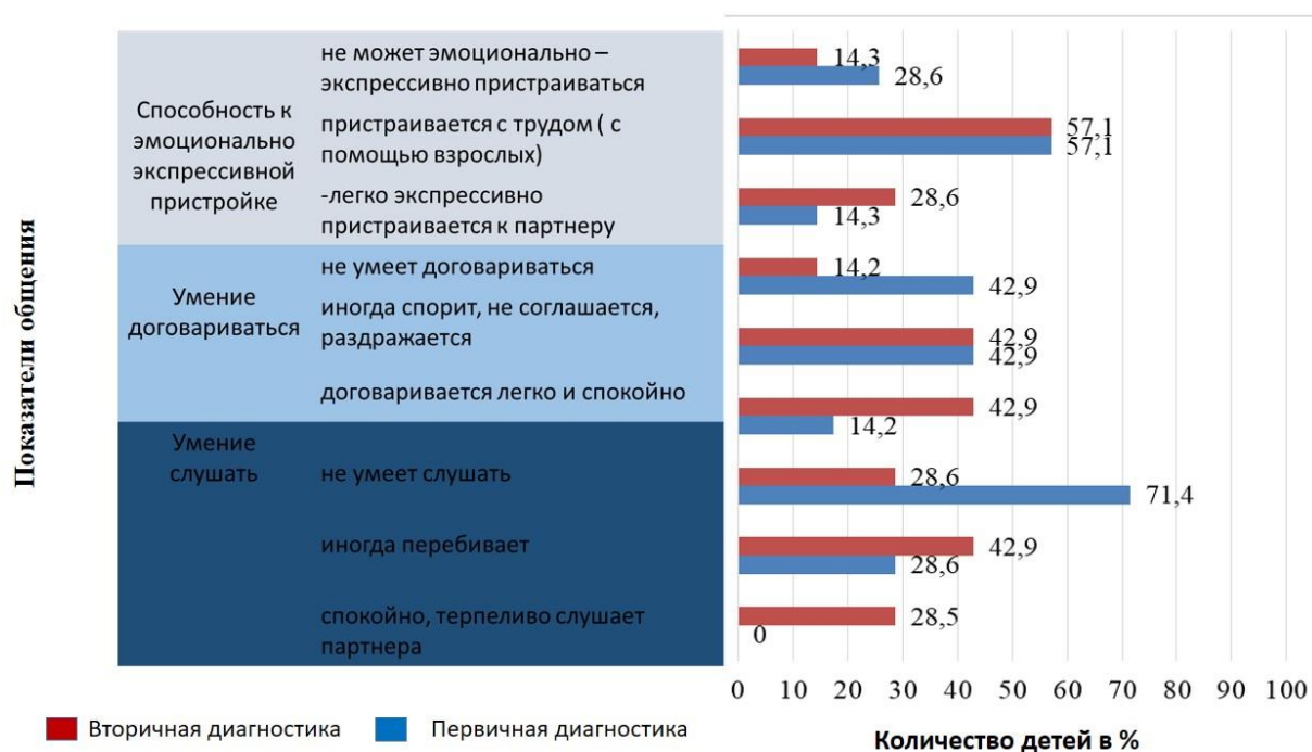
Рис. 3 Динамика сформированности способностей к партнерскому диалогу у детей экспериментальной группы

Обобщенные результаты исследования по методике «Диагностика способностей детей к партнерскому диалогу» (А.М. Щетинина) представлены на рисунке 3 (рис. 3).