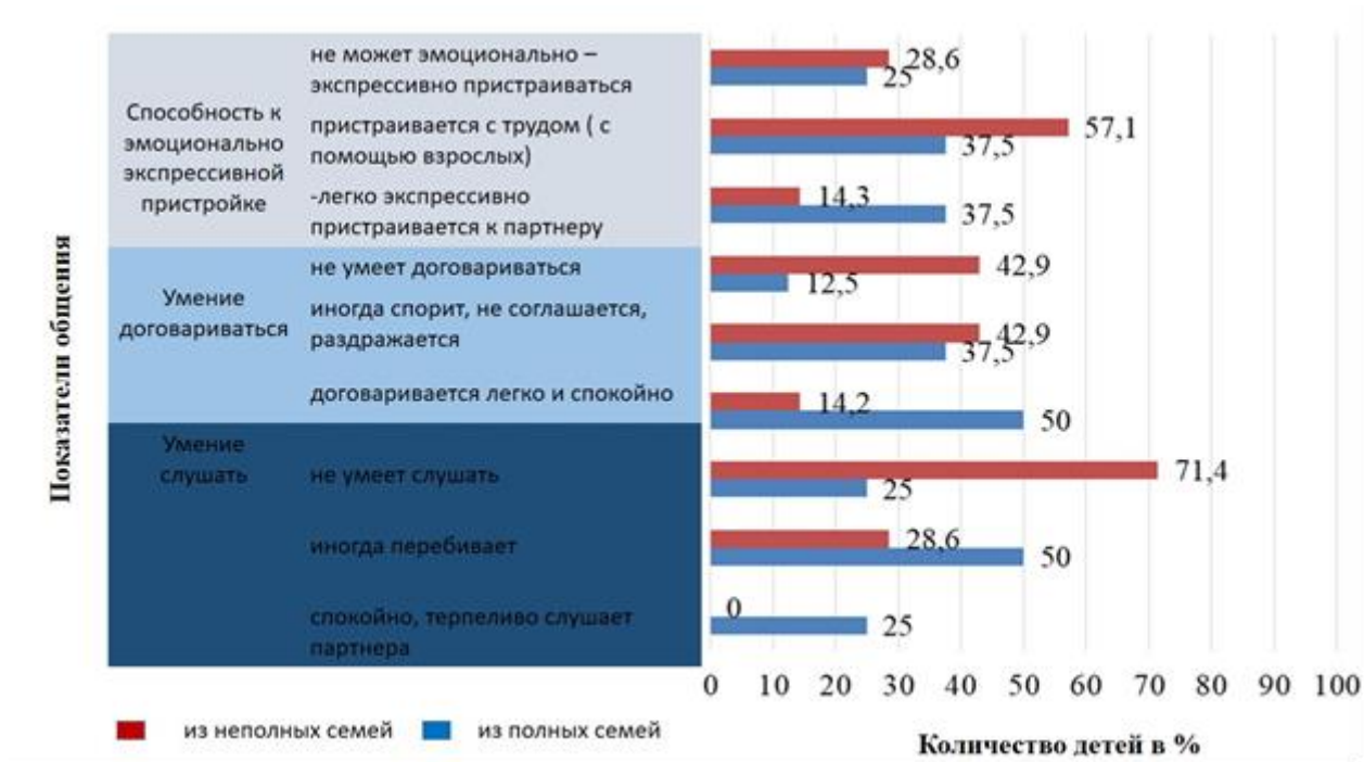
Рис.1. Выраженность показателей общения детей со сверстниками (методика А.М. Щетинина)

Проанализируем полученные результаты детей из полных семей. Для большинства детей из полных семей свойственно ситуативно проявляющееся умение слушать партнера (50%); умение договариваться с партнером (50%); способность к эмоционально-экспрессивной пристройке – самостоятельной (38%) или с помощью взрослого (38%).