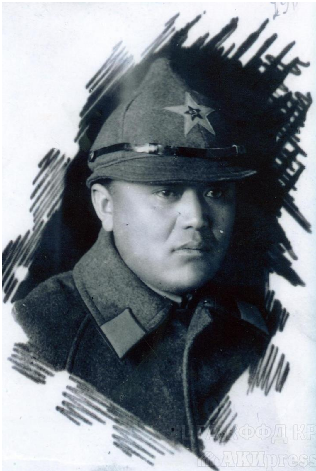
Абдрахманов Юсуп Абдрахманович (28 декабря 1901 - 5 ноября 1938 гг.)