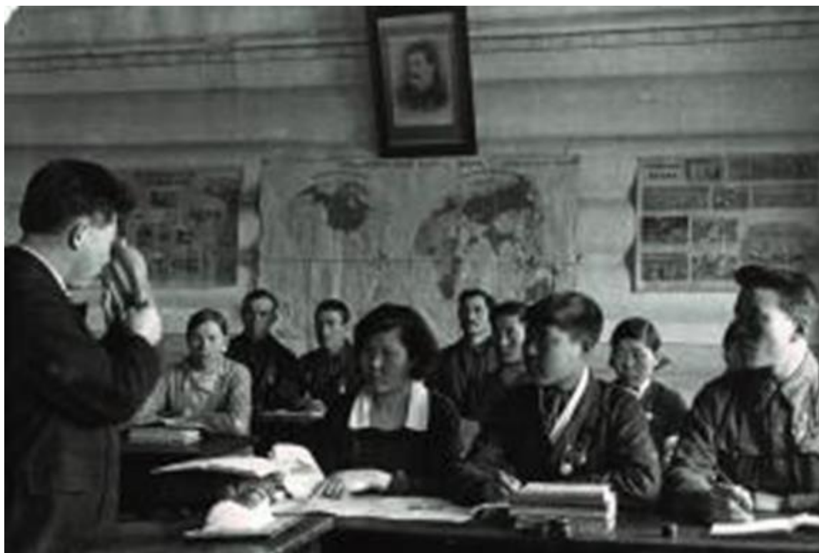
В окружной колхозной школе. 1938 год.