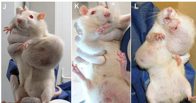
Рисунок 2.4 Изображение подопытных крыс, которых кормили фаст-фудом

Шоковая терапия проводилась на нескольких уроках. На данных уроках было затронуто множество вопросов, один из них: «Какое влияние оказывает на организм человека потребление фаст-фуда?» Выслушав ответы учащихся, которые по большей части говорили о проблеме ожирения и нарушения обмена веществ. На экране были показаны фотографии, взятые из Интернет-ресурса, подопытных крыс, которых кормили фаст-фудом и последствия такого рациона питания в виде различных мутации (Рисунок 2.4).