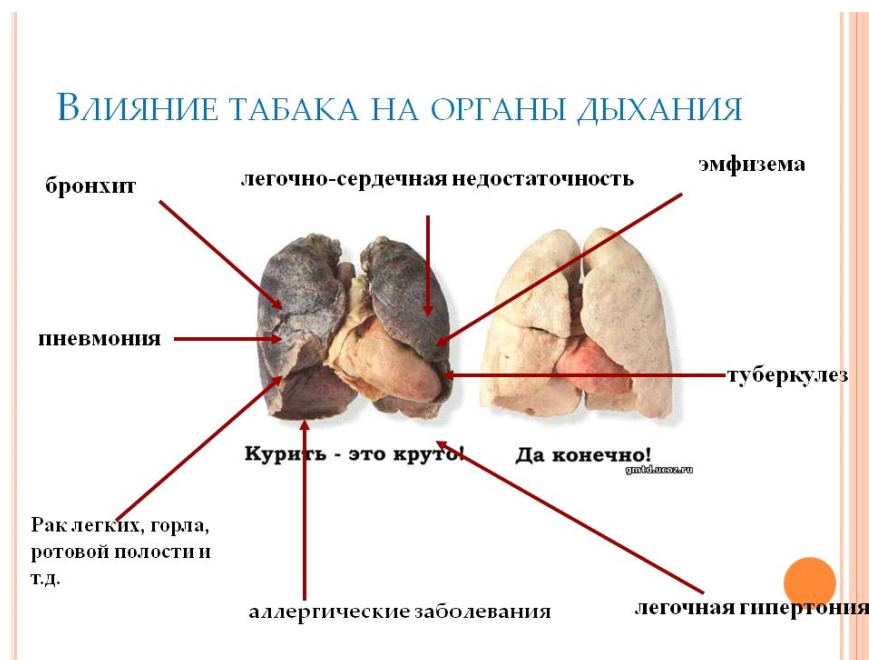
Рисунок 2.5 Влияние табака на органы дыхания.