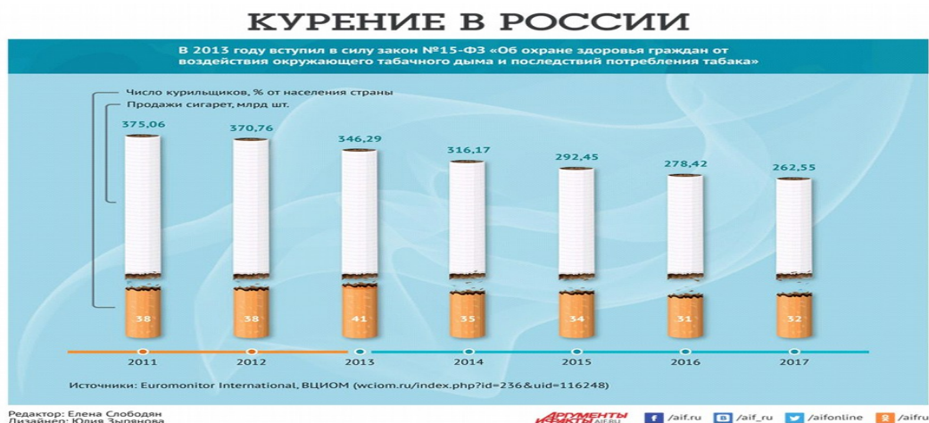
Рис 2. Статистика курения в России.

Надо сказать, что данный закон принес позитивные изменения, это можно увидеть на рис 2., количество курильщиков в нашей стране постепенно уменьшается.