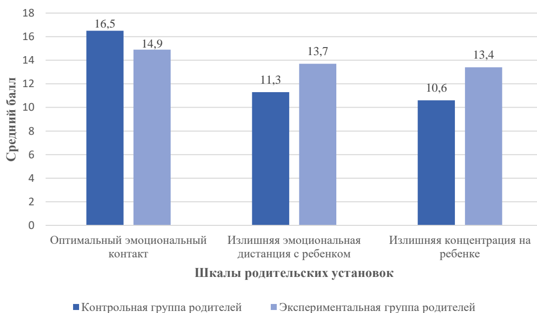
Рис. 1. Соотношение групп шкалирования родительских установок в контрольной и экспериментальной группах (по результатам опросника PARI Е.С. Шафер, Р.К. Белл в адаптации Т.В. Нещерет)

Анализ заполнения опросника родителями показал, что виды влияния родителей на формирование личности ребенка, как в контрольной группе, так и в экспериментальной группе имеют схожие результаты, но значительно отличаются в части основных положений. Высокий тестовый балл по нескольким шкалам свидетельствует о наличии ярко выраженной типологии эмоциональных контактов детско-родительских взаимоотношений (рис. 1).