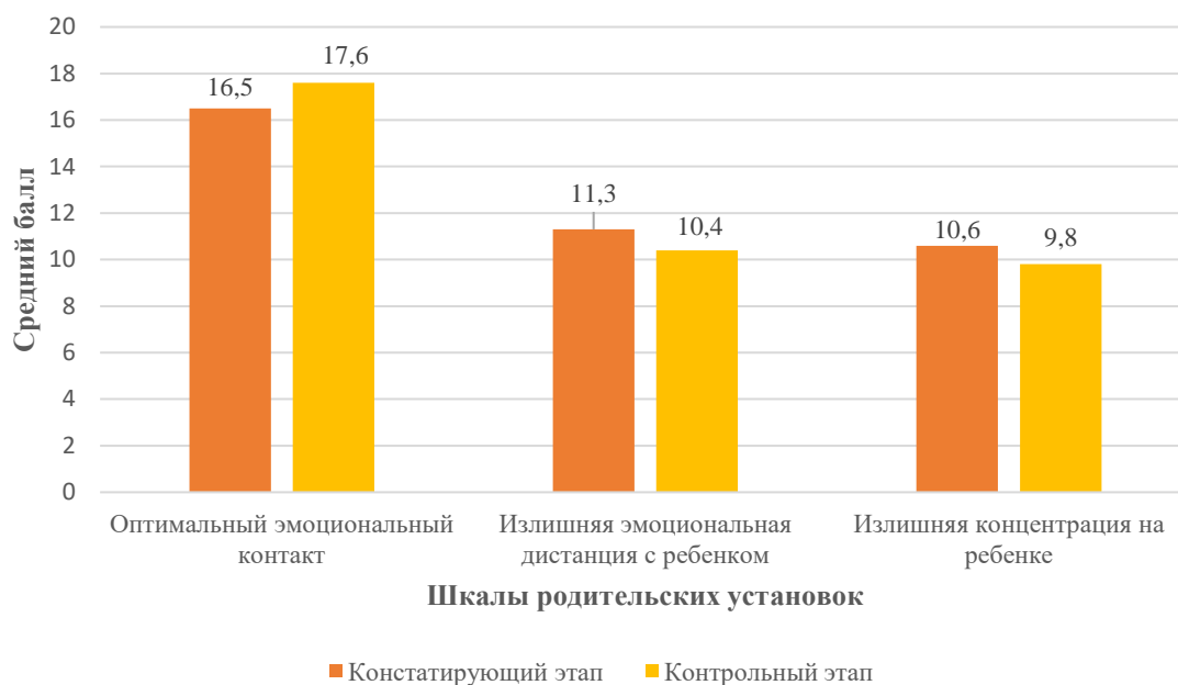
Рис. 3. Сравнительные данные констатирующего и контрольного этапов исследования участников контрольной группы (по результатам опросника PARI Е.С. Шафер, Р.К. Белл в адаптации Т.В. Нещерет)

Сравнительные данные опросника родительских установок (PARI) Е.С. Шафер, Р.К. Белл в адаптации Т.В. Нещерет показали, что детско-родительские отношения в семьях с детьми старшего дошкольного возраста контрольной группы практически не изменились.