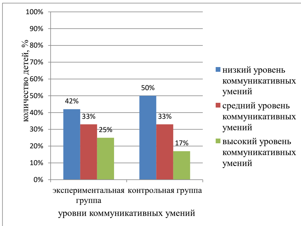
Рисунок 1. Распределение детей по уровням развития коммуникативных умений

Анализ результатов по методике «Изучение коммуникативных умений» Г.А. Урунтаевой, Ю.А. Афонькиной представлены на рисунке 1.