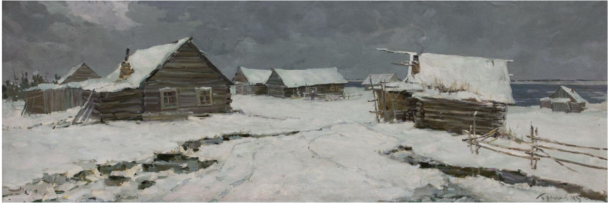
Б. Рязов «Станок Курейка»