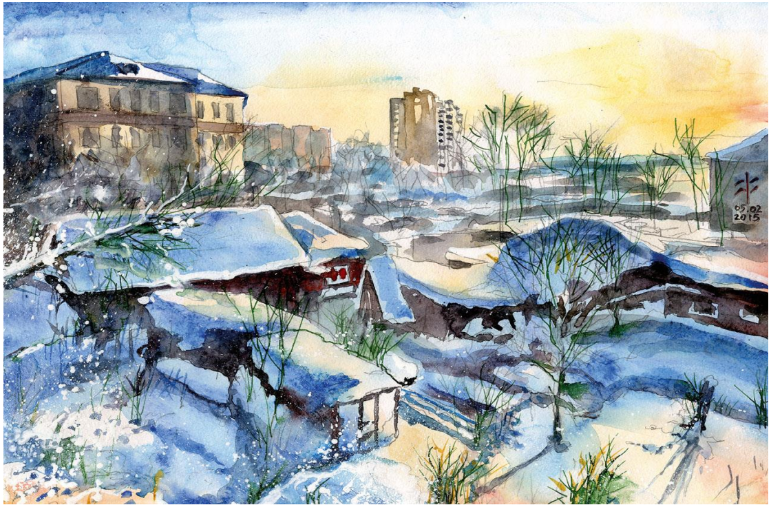
В. Курилов «Зимнее солнце»