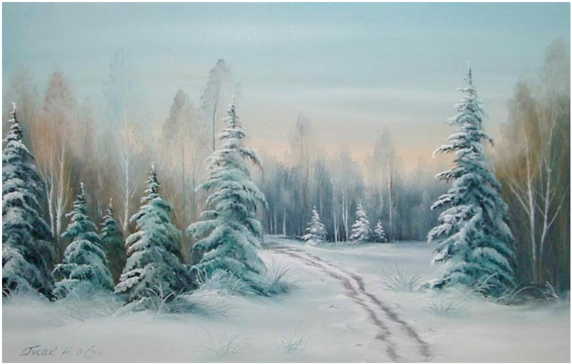
Н. Гусак «Снежные ели»