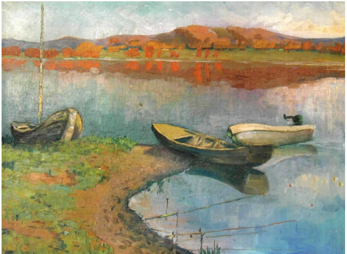
В. Стволов «Пейзаж. Лодки. Река»