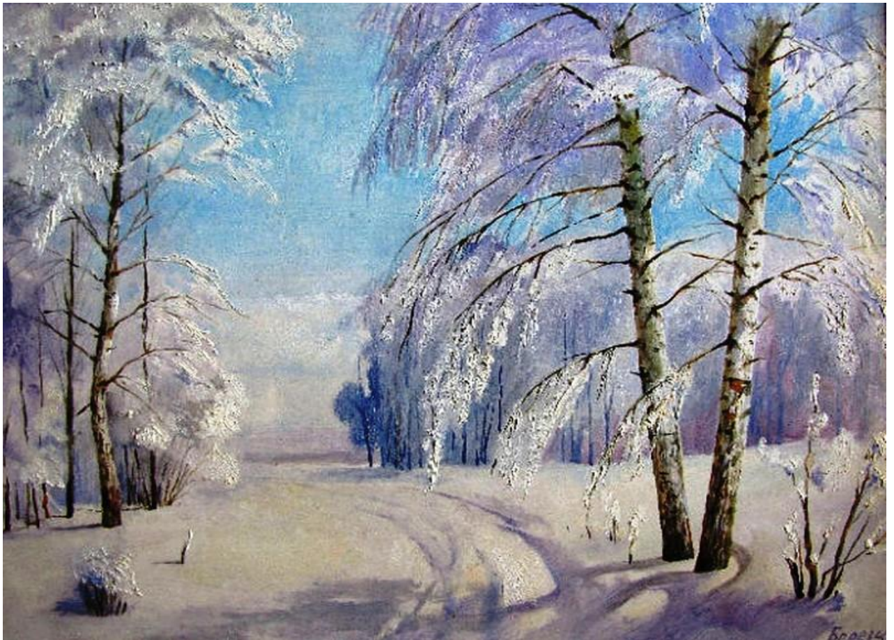
В. Берзин «Зимний лес»