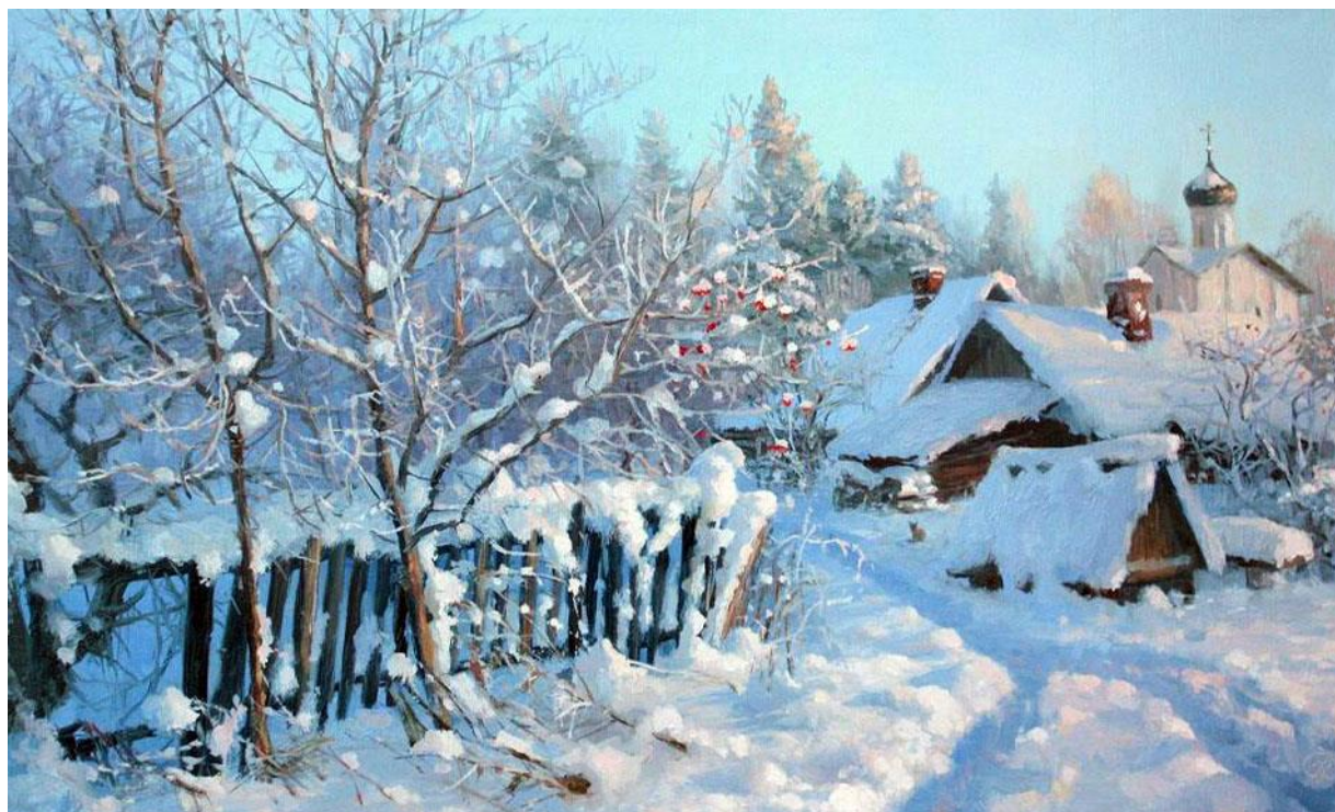
В.Жданов «На улице»