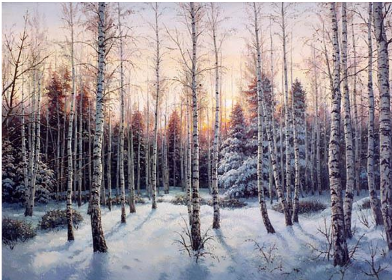
С. Ханин «Зимний пейзаж»