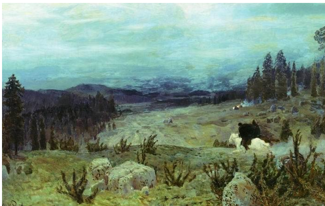
А. Васнецов «Сибирь»