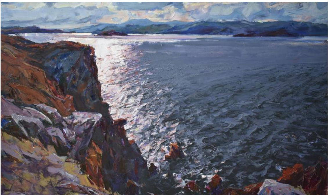
А. Павленкович «Енисей»