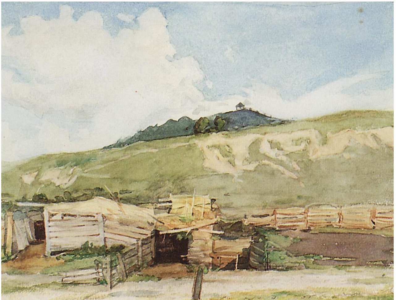
В. Суриков «Сибирский пейзаж. Торгашино»