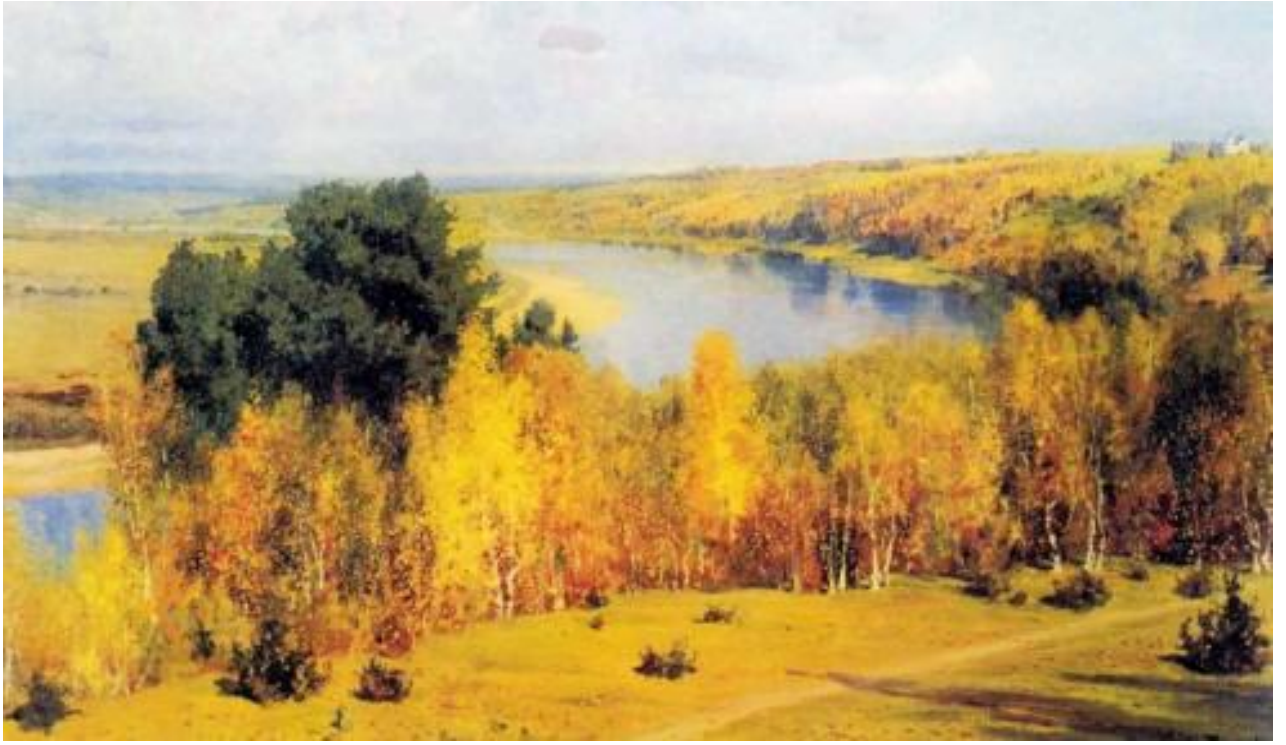
В. Поленов «Золотая осень»