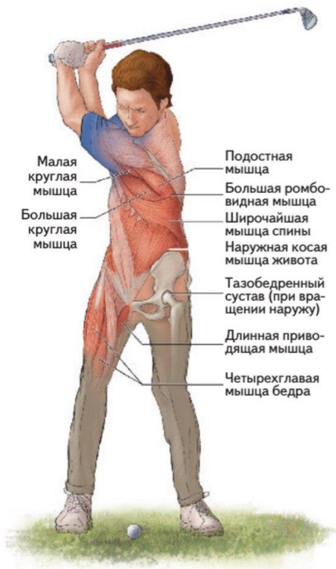
Рисунок 1. Мышцы, участвующие в выполнении замаха