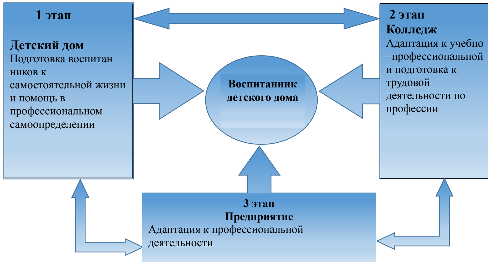
Рисунок 3 - Модель сетевого наставничества