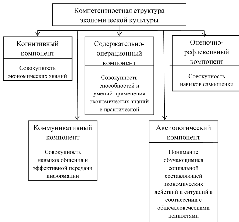
Рис. 1. Компетентностная структура экономической культуры

Компетентностная структура экономической культуры, по нашему мнению, должна включать в себя пять основных компонентов: когнитивный, содержательно-операционный, оценочно-рефлексивный, коммуникативный и аксиологический (рис. 1). Только совокупность указанных компонентов может обеспечить эффективное развитие экономического мышления и культуры обучающихся с учетом всестороннего развития личности.