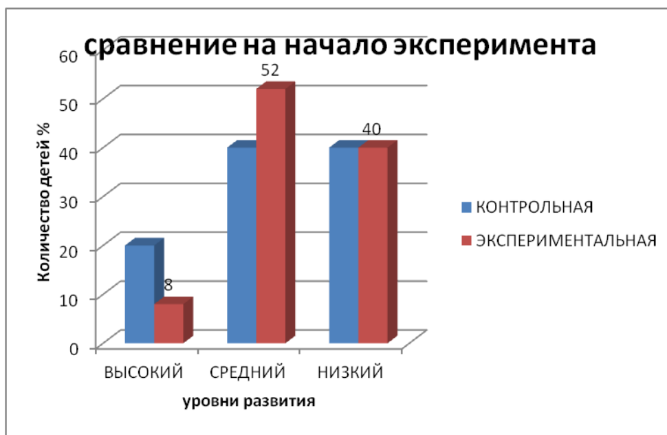
Рис.3 Сравнительные результаты исследования детей обеих групп на начало эксперимента

67% ,то по итогам проделанной работы он снизился до 40 %. Мы с уверенностью можем сказать, что благодаря данному проекту дети стали называть свое имя и фамилию. Так же в данном уровне дети не имели представления о своей родословной. После проекта дети стали иметь представления о семейных традициях и праздниках. Родители стали вовлекать своих детей в домашние семейные традиции, приобщать к семейным праздникам. Могли дать характеристику, женским, и мужским праздникам. У детей данного уровня, можно отметить, что они стали называть своих близких и дальних родственников. Дети могут рассказать о профессиях свои родителей. Но по-прежнему, затрудняются рассказать о истории своей семьи. Также не знают, и не могут составить связный рассказ о семье. Но благодаря проделанной работе можно заметить, что у детей повысились знания по теме семья.