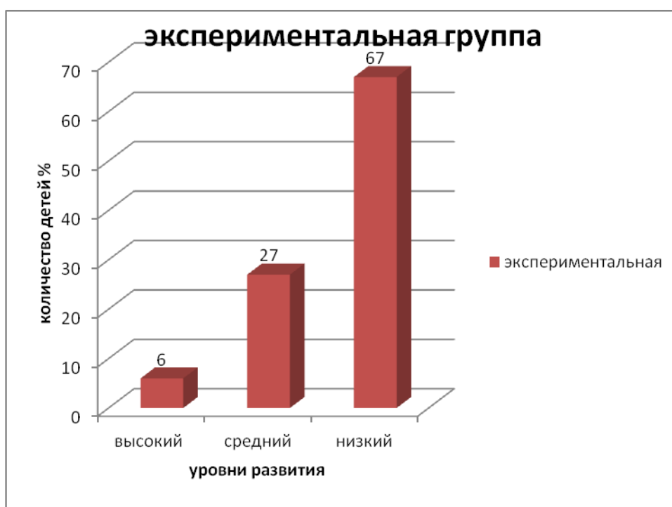
Рис.2. Уровень сформированности представлений о семье у детей экспериментальной группы

Используя данную методику в экспериментальной группе, мы определили что, 6 % детей имеют высокий уровень сформированности представлений о своей семье: А значит, дети знают и называют свое имя, свою фамилию, также называют свое отчество, могут посчитать свой возраст. Знают и называют имена своих родителей, но имеют не значительные затруднения с названием домашнего адреса. Воспитанники говорят фамилию родителей и близких родственников. Могут назвать своих дальних