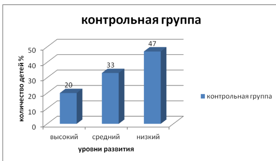
Рис.1. Уровни сформированности представлений о семье у детей контрольной группы

Наглядно данные Таблицы 1 представлены на рис. 1