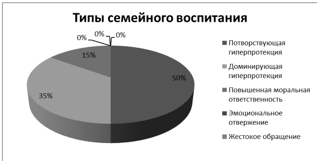
Рис. 3. Результаты диагностики типа семейного воспитания (Опросник «Анализ семейных взаимоотношений» (Методика АСВ) (Эйдемиллер Э.Г., Юстицкис В. В.))

Методика 4. Опросник для родителей (Ардашева С.В.).