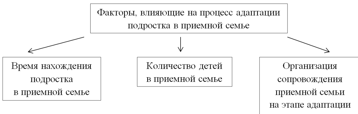
Рис. 1. Факторы, влияющие на процесс адаптации подростка в приемной семье (опекаемой семье).

Факторы, оказывающие влияние на процесс адаптации подростка в приемной семье (рис.1) [15, с. 9]: