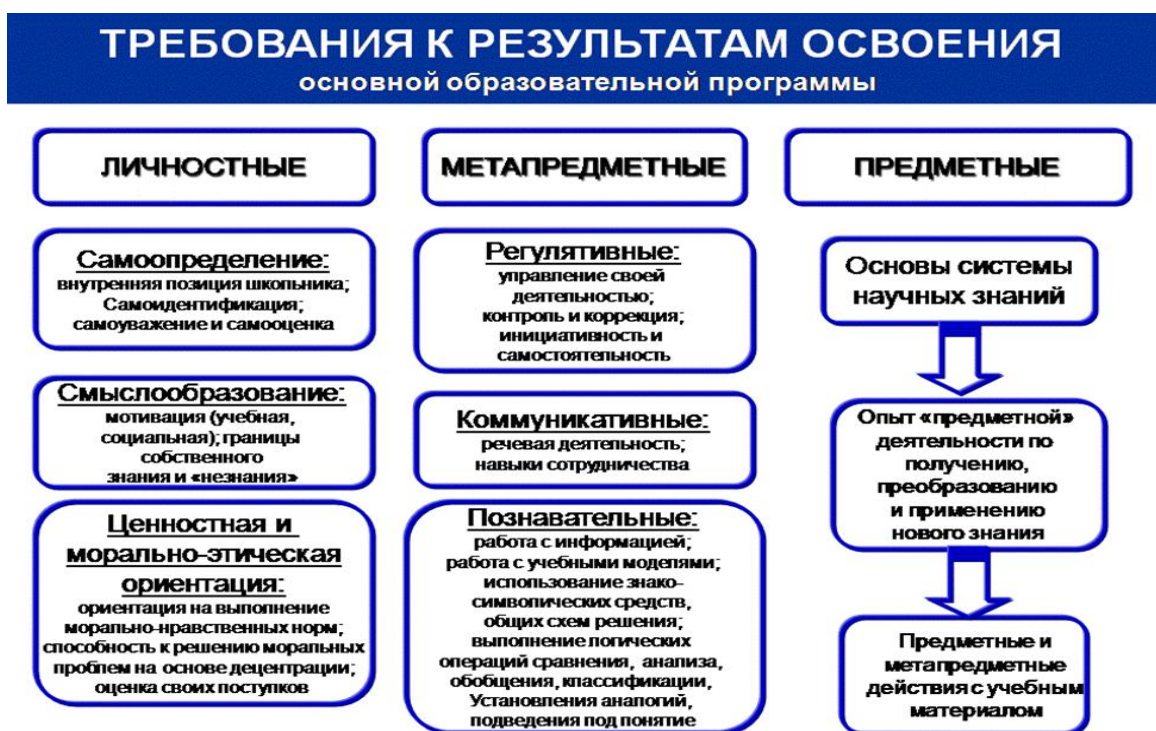
Рисунок 1 – Требования к результатам освоения основной образовательной программы

Универсальные учебные действия выполняют следующие функции: