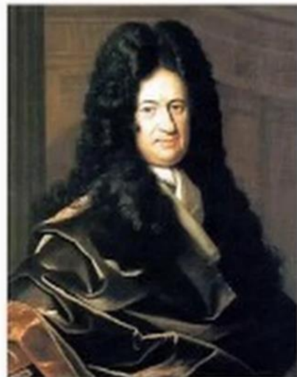
Г.В. Лейбниц 1646–1716 гг.

«Вычисление с помощью двоек... является для науки основным и порождает новые открытия... При сведении чисел к простейшим началам, каковы 0 и 1, везде проявляется чудесный порядок».