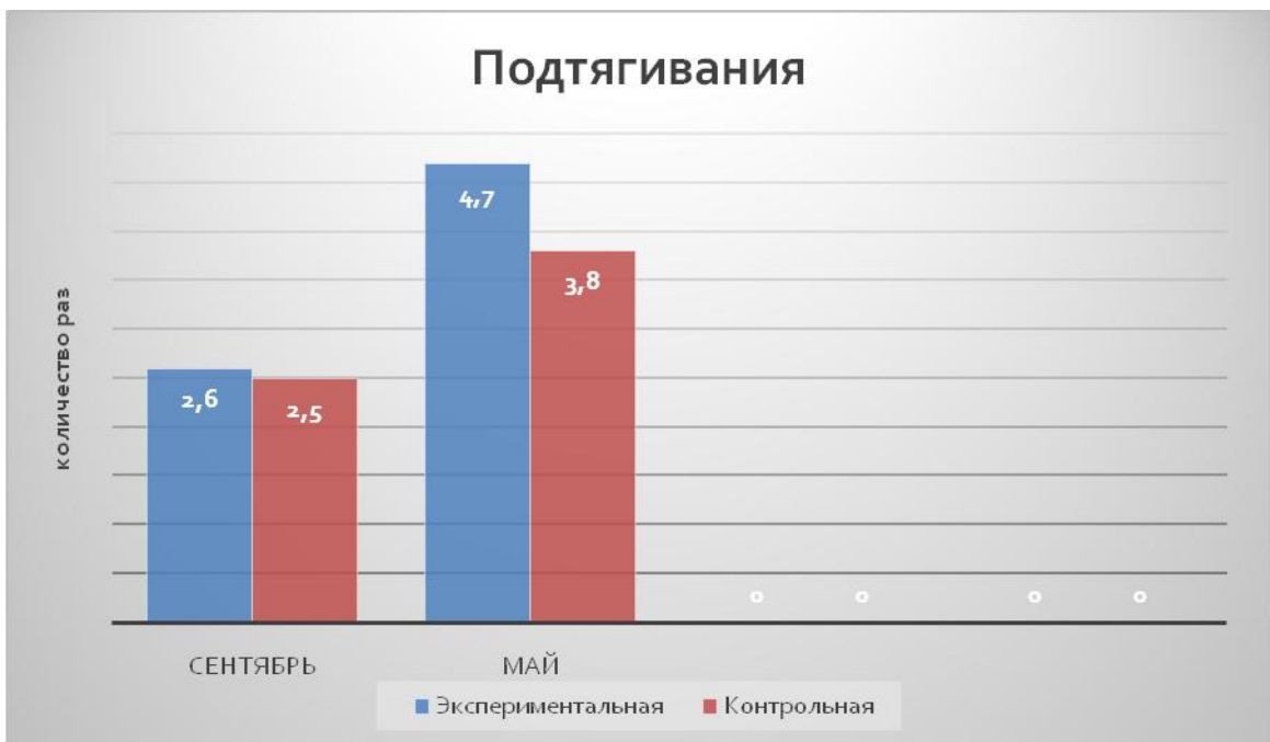
Рисунок 1. Результаты контрольных испытаний (подтягивание на перекладине) экспериментальной и контрольной групп (сентябрь-апрель)