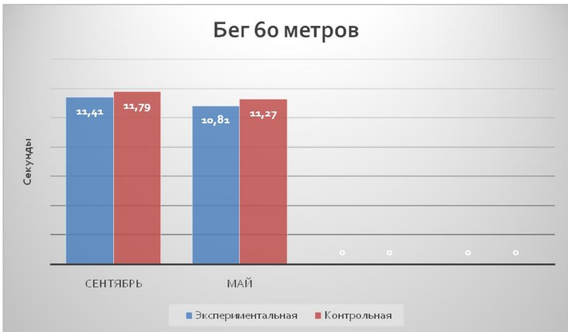
Рисунок 2. Результаты контрольных испытаний (бег на 60 м) экспериментальной и контрольной групп (сентябрь-апрель)

Как видно из таблиц и рисунков в контрольных испытаниях на развитие скоростно-силовых качеств обучающихся младшего школьного возраста в экспериментальной группе произошли значительные изменения. Это связано с эффективностью предложенных и использованных комплексов упражнений, развивающих скоростно-силовые качества обучающихся младшего школьного возраста на уроках по физической культуре.