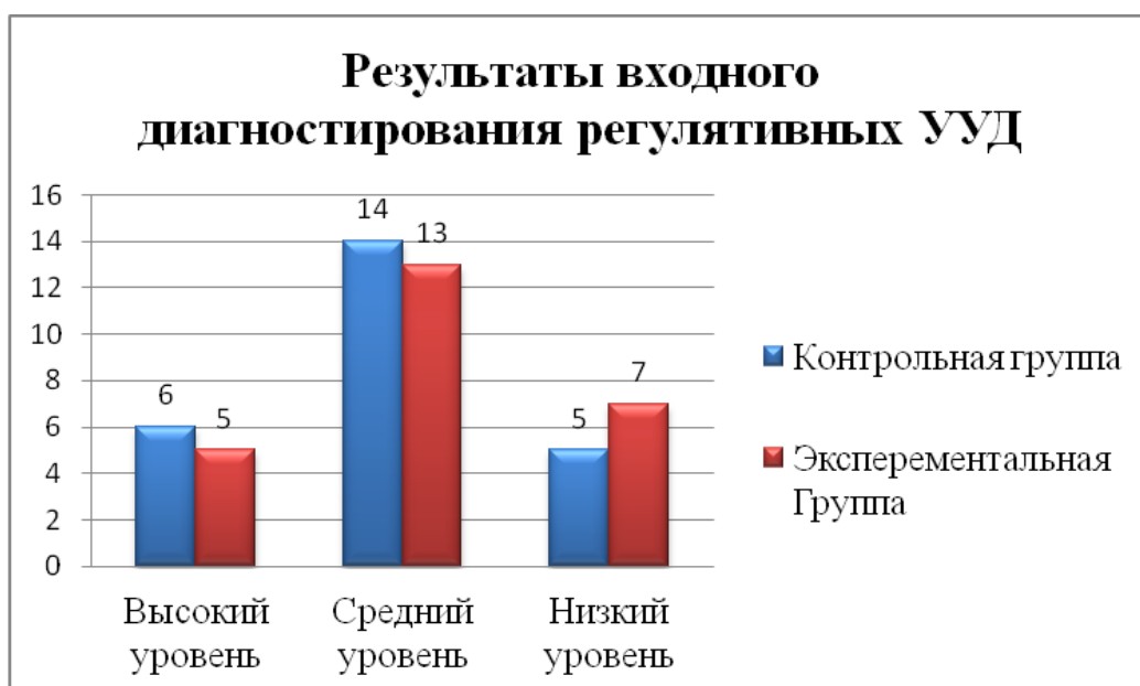
Рисунок 1. Результаты входного диагностирования регулятивных УУД

Из диаграммы видно: полученные данные показывают, что у экспериментальной группы уровень сформированности регулятивных универсальных учебных действий составил 20%, а в контрольной группе учащихся на 4 % выше, т.е. – 24%. Средний уровень сформированности регулятивных универсальных действий экспериментальной группы составил 52%, и на 4% больше средний уровень сформированности регулятивных универсальных учебных действий контрольной группы составил 56%. Уровень сформированности регулятивных универсальных действий, который считается ниже среднего в экспериментальной группе составляет 28 % а в контрольной группе на 8 % меньше и составляет 20%. Из представленной диаграммы мы видим, что результаты сформированности регулятивных УУД примерно одинаковы в обеих группах.