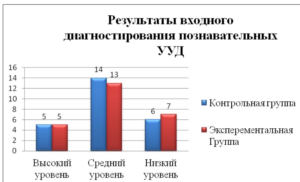
Рисунок 2. Результаты входного диагностирования познавательных УУД.

Из диаграммы видно, что в контрольном и экспериментальной группах уровень сформированности познавательных УУД примерно одинаков: высокий уровень по 20% в каждой группе. У 52 % учащихся экспериментальной и 56 % учащихся контрольной группы уровень сформированности на среднем уровне. Низкий уровень в экспериментальной группе составляет 28%, и в контрольной 24%.