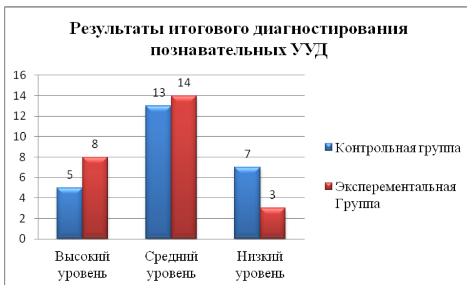
Рисунок 5. Результаты итогового диагностирования познавательных УУД.

Диаграмма показывает, что в экспериментальном классе в сравнении с контрольным уровень сформированности регулятивных универсальных учебных действий выше: высокий уровень сформированности регулятивных универсальных учебных действий экспериментальной группе составляет 32 %, в контрольной группе – 24%, что на 8 % больше. Средний уровень сформированности регулятивных универсальных учебных действий в контрольной и экспериментальной группах примерно одинаков: 52 % в контрольной группе и 56 % в экспериментальной группе. Показатель низкого уровня сформированности регулятивных универсальных учебных действий в экспериментальном классе на 12 % ниже, чем в контрольном и составляет 12 %.