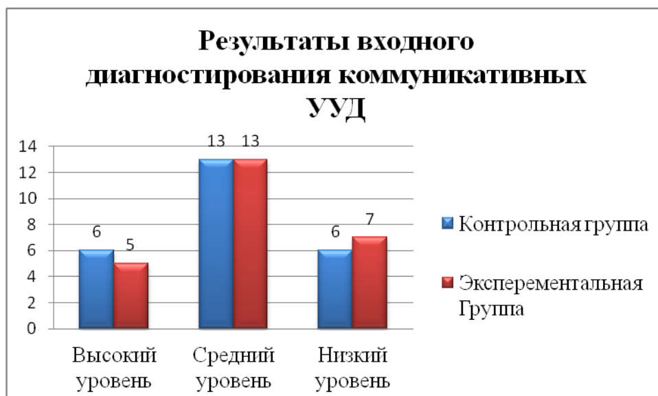
Рисунок 3. Результаты входного диагностирования коммуниктивных УУД.

Из диаграммы видно, что в контрольном и экспериментальной группах уровень сформированности познавательных УУД примерно одинаков: высокий уровень по 20% в каждой группе. У 52 % учащихся экспериментальной и 56 % учащихся контрольной группы уровень сформированности на среднем уровне. Низкий уровень в экспериментальной группе составляет 28%, и в контрольной 24%.