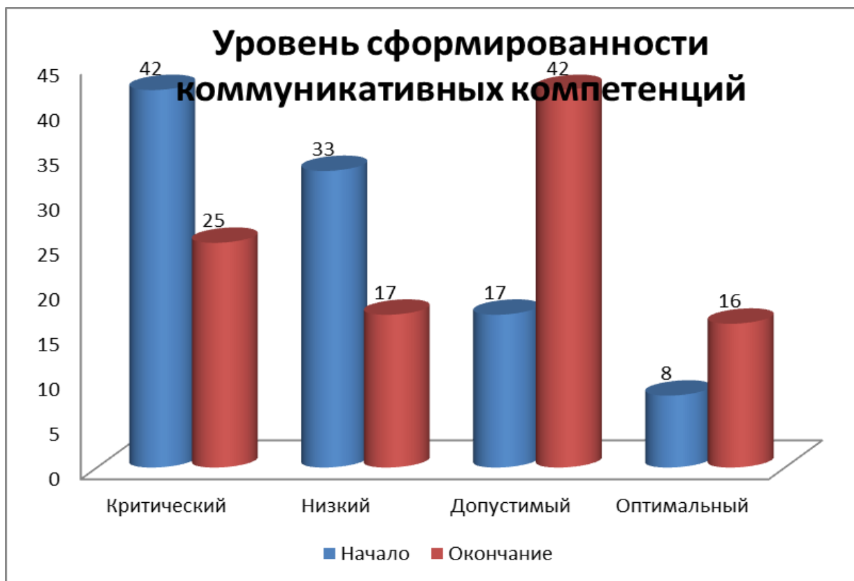
Рис. 7. Уровень сформированности коммуникативных компетенций

При анализе результатов сформированности коммуникативных компетенций, мы видим схожие картины с организационными компетенциями: после окончания эксперимента критический уровень сформированности коммуникативной компетенции в классе уменьшился с 42% до 25%, тоже самое произошло с низким уровнем (снижение с 33% до 17%); увеличилось число учащихся с допустимым уровнем общительности и взаимодействия – с двух до пяти, что повлияло на успеваемость; на оптимальном уровне работают два человека (в начале была одна ученица).