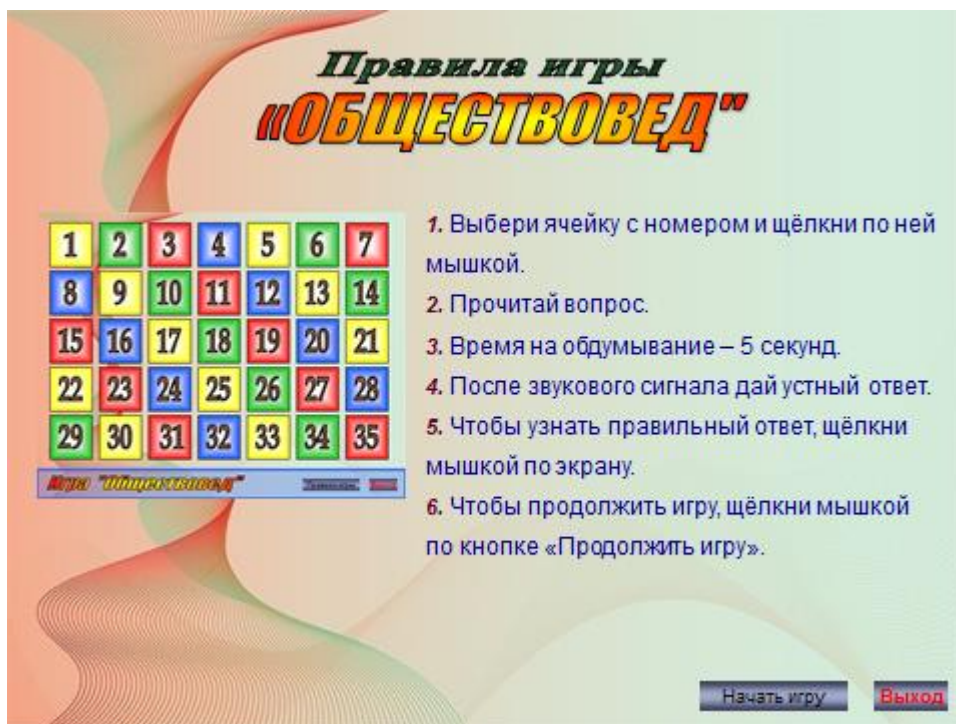
Рис. 4 Скриншот экрана при открытии игры «Обществовед»

Применение данного интерактивного метода позволило более успешно решить следующие задачи: образовательные: - способствовать более прочному усвоению учащимися пройденного учебного материала; развивающие: - развивать у учащихся творческое мышление; - способствовать практическому применению умений и навыков, полученных на уроках; воспитательные: - вырабатывать самосознание - способствовать воспитанию саморазвивающейся и самореализующейся личности.