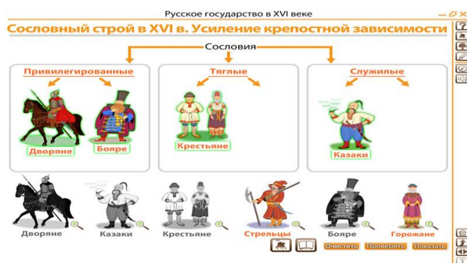
Рис.1. Интерактивный плакат для урока истории

активный плакат «Сословный строй XVI в.» для урока истории в 7 классе. Интерактивный плакат – электронное образовательное средство нового типа, имеющее интерактивную навигацию, которая позволяет отобразить необходимую информацию: графику, текст, звук. С помощью различных программ разрабатываются изображения, на которых при выделении одной части появляется его краткая характеристика.