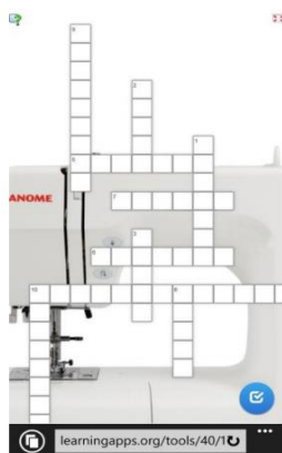
Рис.3. Скриншот экрана смартфона при открытии интерактивного кроссворда

Активизация познавательной деятельности учащихся на уроке – одно из наиболее существенных требований, обеспечивающих качество обучения. С этой целью на уроках истории можно использовать интерактивные кроссворды. Мы создали интерактивный кроссворд «Фараоны» по теме урока «Великие походы фараонов» история 5 класс.