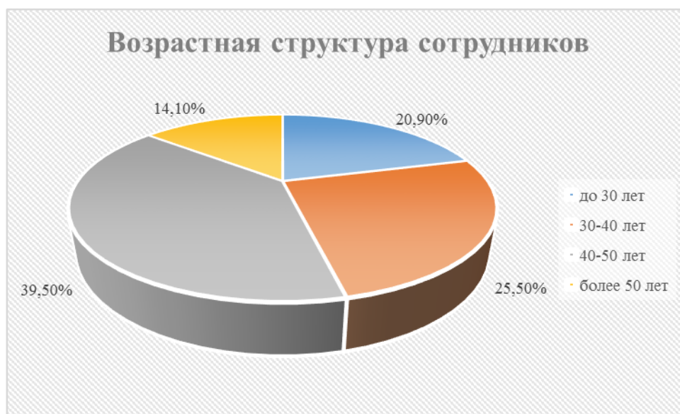
Рис. 2. Возрастная структура сотрудников КГБУ СО «Тинской психоневрологический интернат»

Возрастная структура сотрудников выглядит следующим образом: до 30 лет – 20,9 %; 30 – 40 лет – 25,5 %; 40 – 50 лет – 39,5 %; более 50 лет – 14,1% (рис. 2).