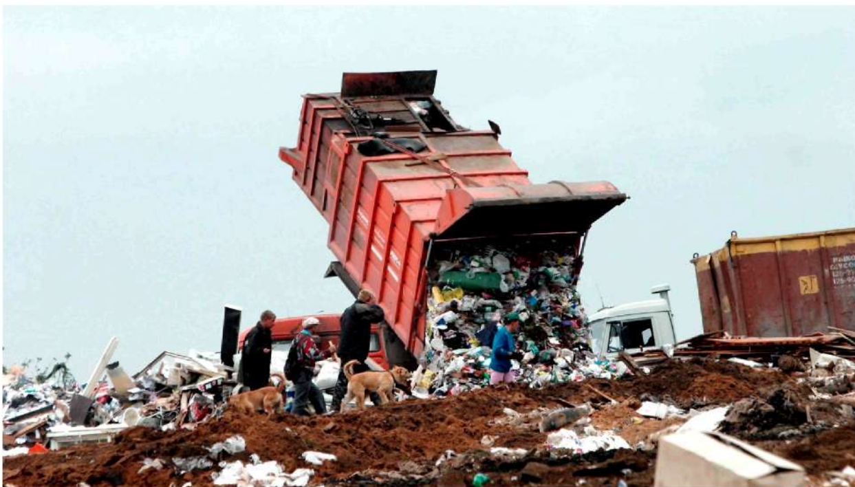
Рис. 4. Свалка

- Сжигание. Наиболее распространенный вариант избавления от утильсырья, однако подобные методы крайне негативно сказываются на окружающей среде. В связи с этим современный комплекс и схема управления отходами заменяет сжигание на пиролиз.