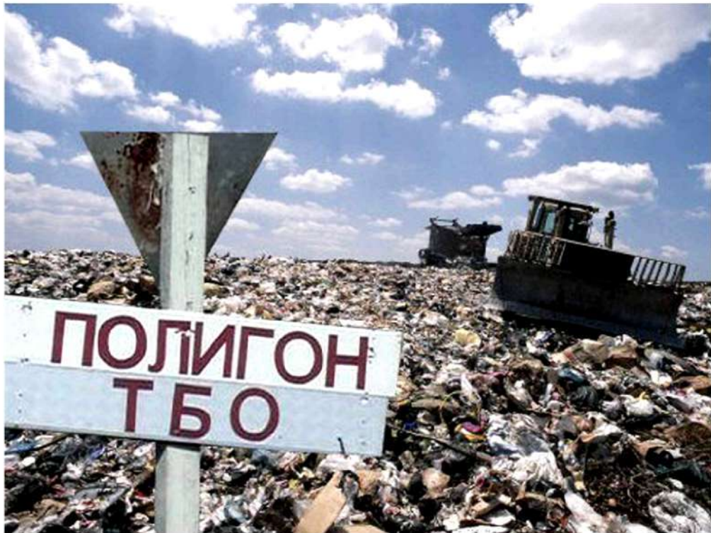
Рис. 5. Полигон ТБО

Главный минус традиционного захоронения отходов заключается в том, что даже при использовании многочисленных систем очистки и фильтров этот вид утилизации не дает возможности полностью избавиться от таких негативных эффектов разложения отходов как гниение и ферментация, которые загрязняют воздух и воду. Поэтому, хотя относительно других способов утилизации, захоронение ТБО стоит достаточно дешево, экологи рекомендуют перерабатывать отходы, сводя к минимуму тем самым риски загрязнения окружающей среды.