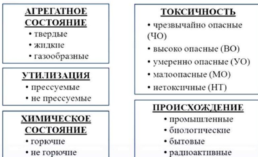
Рис. 1. Классификация отходов.

Отходами называют вещества или отработки производства, которые потеряли потребительские свойства и не могут быть использованы. Для безопасного обращения с мусором была разработана классификация отходов. Большинство веществ из этих отходов может быть использовано повторно, ограничением непригодности является экономическая целесообразность и отсутствие передовых технологий. Мусор, что мы выбрасываем, может быть ценным сырьем, если мы поймем, как это сырье дешево перерабатывать. Классификация отходов обоснована множеством факторов, которые объясняют наличие нескольких категорий (рис.1).