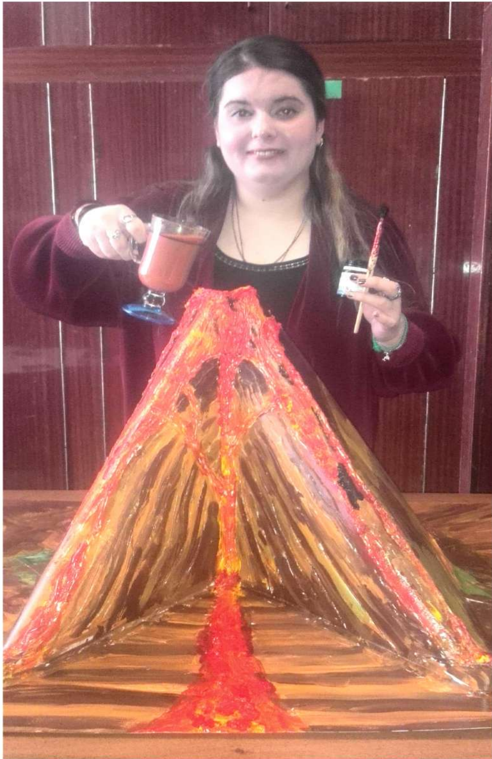
Макет вулкана готов!