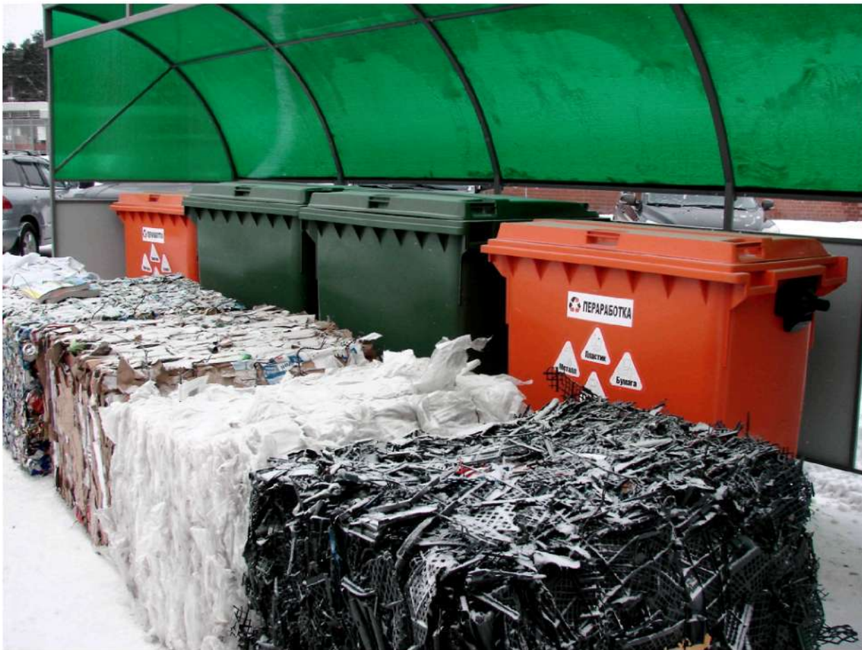
Рис. 3. Переработка мусора