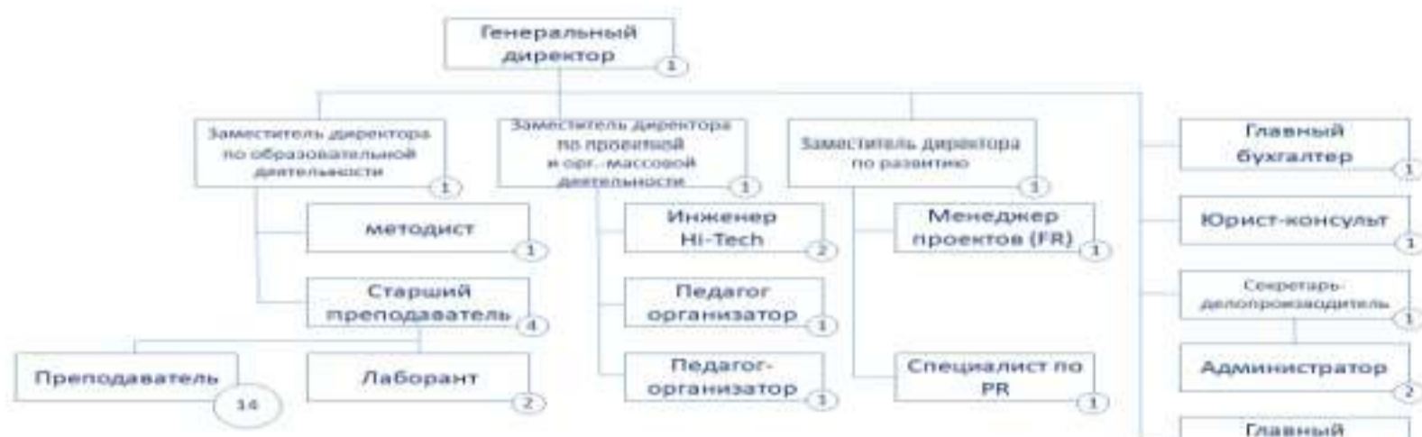
Рис. 2. Проект организационной структуры АНО «Красноярский детский технопарк «Кванториум»

Дополнительные полномочия наблюдательного совета, порядок деятельности, порядок оформления решений наблюдательного совета регламентируются Положением о наблюдательном совете АНО.