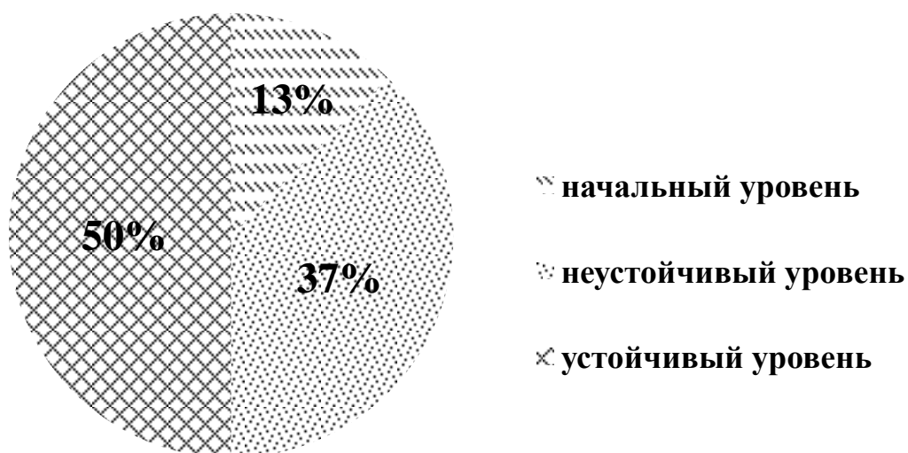
Рис. 4. Оценка уровня сформированности социальной компетентности детей старшего дошкольного возраста после формирующих мероприятий

Подводя итог вышесказанному, мы пришли к мнению, что развивающие мероприятия и совместная деятельность педагога с детьми и сверстниками положительно влияют на развитие социальной компетентности детей старшего дошкольного возраста, то есть: