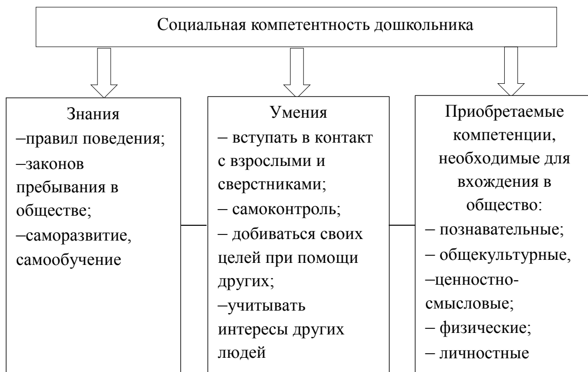
Рис. 1. Компоненты социальной компетентности детей дошкольного возраста

Благодаря этим качествам формируется социальный опыт и социальная зрелость дошкольника, раскрываются его скрытые потенциальные возможности. Стоит отметить, что важным моментом является именно осмысление и успешное усвоение дошкольником необходимых знаний, умений, компетенций для его социальной жизни и дальнейшего взаимодействия с взрослыми и сверстниками.