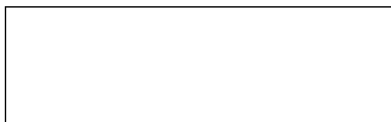
Рис. 1. Взаимосвязь между различными этапами научного исследования

Все, что не является таблицами, – схемы, диаграммы, графики и т. п. – называется рисунками. Рисунки подписываются снизу. Например: