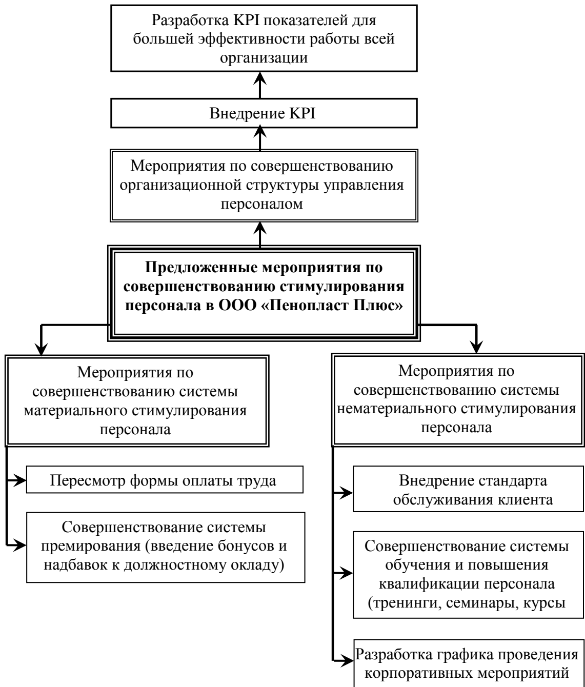
Рис.7. Схема предложенных мероприятий по совершенствованию системы стимулирования персонала ООО «Пенопласт Плюс»