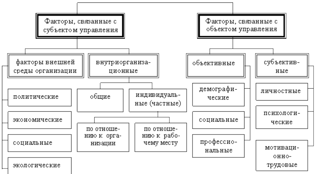
Рис. 5. Факторы, влияющие на стимулирования труда

тарифные сетки, тарифно-квалификационные справочники, официальные зарплаты и т.д. Компания разработала коллективный договор, в котором, в соответствии с финансовыми возможностями, скорректированы с целью повышения ставки заработной платы. Также устанавливает самый низкий уровень оплаты за выполнение рабочей нормы, которая является минимальной тарифной ставкой.