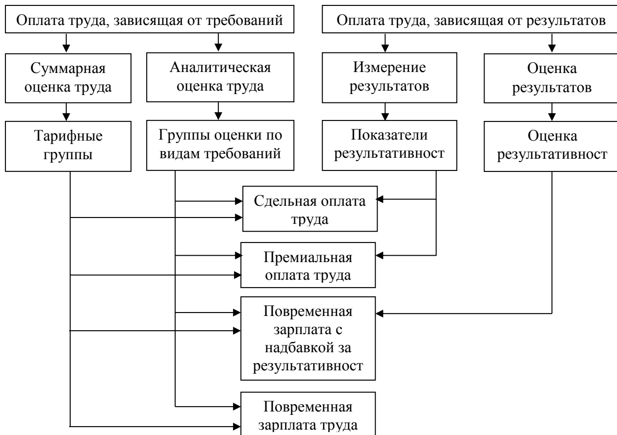
Рис. 4. Основные принципы оплаты труда на предприятии

необходимо описание требований и их соответствие определенной категории, тарифной группе.