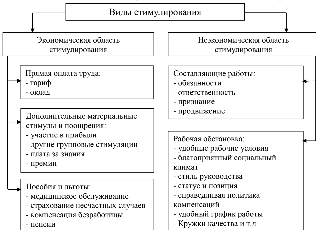
Рис.3. Стимулирование персонала организации

сотрудников играет применение определенных стимулов для создания соответствующих мотивов, которые называются системой стимулирования.