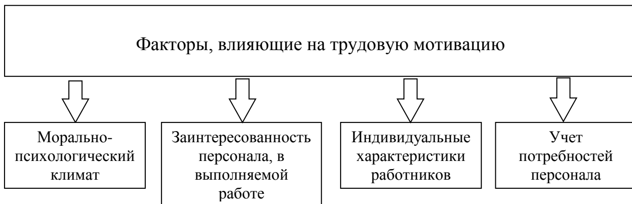
Рис.1. Факторы, влияющие на трудовую мотивацию

одновременно находится в компетенции менеджмента всех уровней и направлений деятельности. Но до сих пор во многих российских организациях выбор инструментов стимулирования основывается на интуиции менеджера, который в своих кадровых решениях опирается на опыт работы, контакты с людьми, информацию о своих подчиненных [12, с.46].