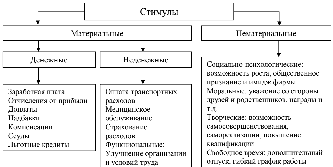
Рис.2. Виды стимулов в организации

Стимулы могут быть материальными и нематериальными, а стимулирования экономическим и неэкономическим (рисунок 2 и 3). Стимулами выступают любые блага (потребности), получение которых предполагает трудовую деятельность, то есть благо становится стимулом труда, если оно формирует мотив труда.