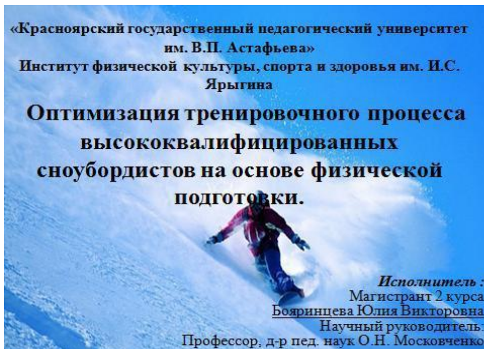
Рисунок 1 – Образец оформления титульного слайда презентации Текстовая информация на слайде может быть расположена либо в виде маркированного списка (рисунок 2), либо в две колонки (рисунок 3).

Создание презентации целесообразно начинать с разработки проекта, в котором необходимо определить примерное количество слайдов в презентации и их содержание. Первый слайд презентации обычно содержит название, сведения о студенте, выполнившем работу, и создается на основе Титульного слайда (рисунок 1).