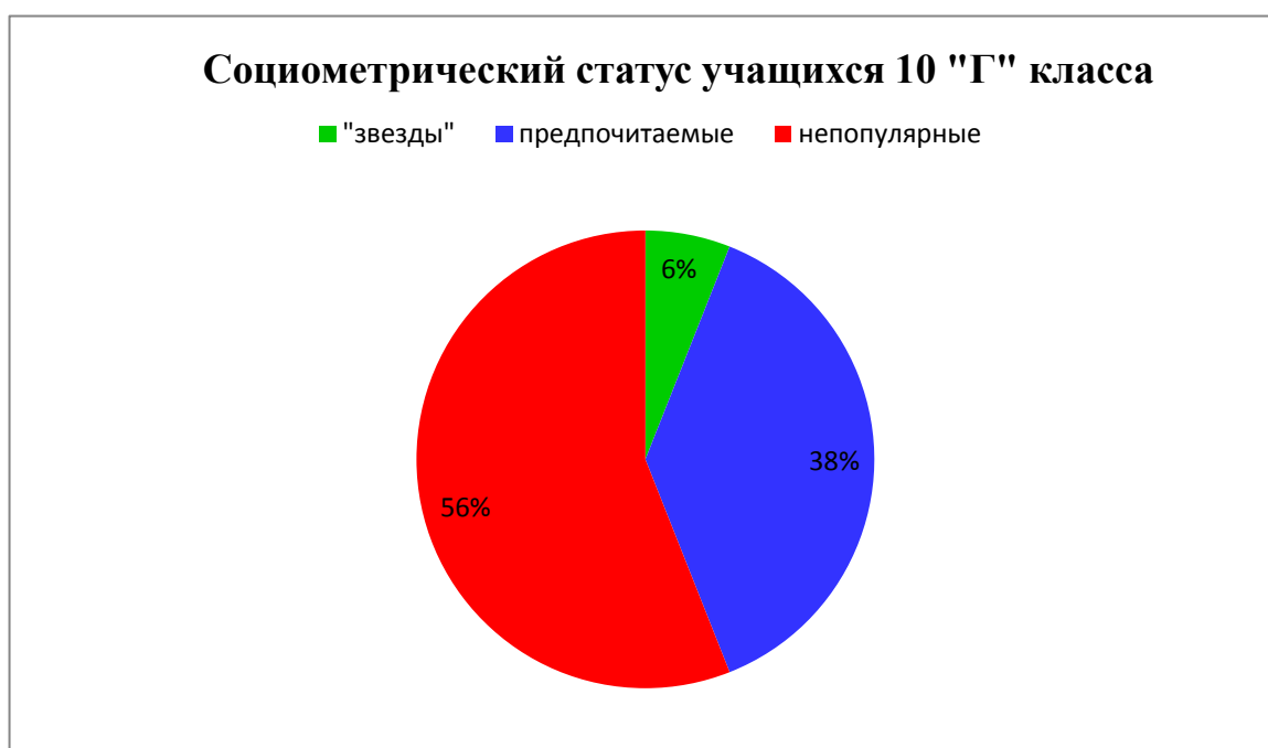
Рис. 5. Результаты исследования М. Битяновой «Социометрический метод» в 10 «Г» классе.

В общем виде данные показатели можно отобразить в виде диаграммы (Рис. 5)