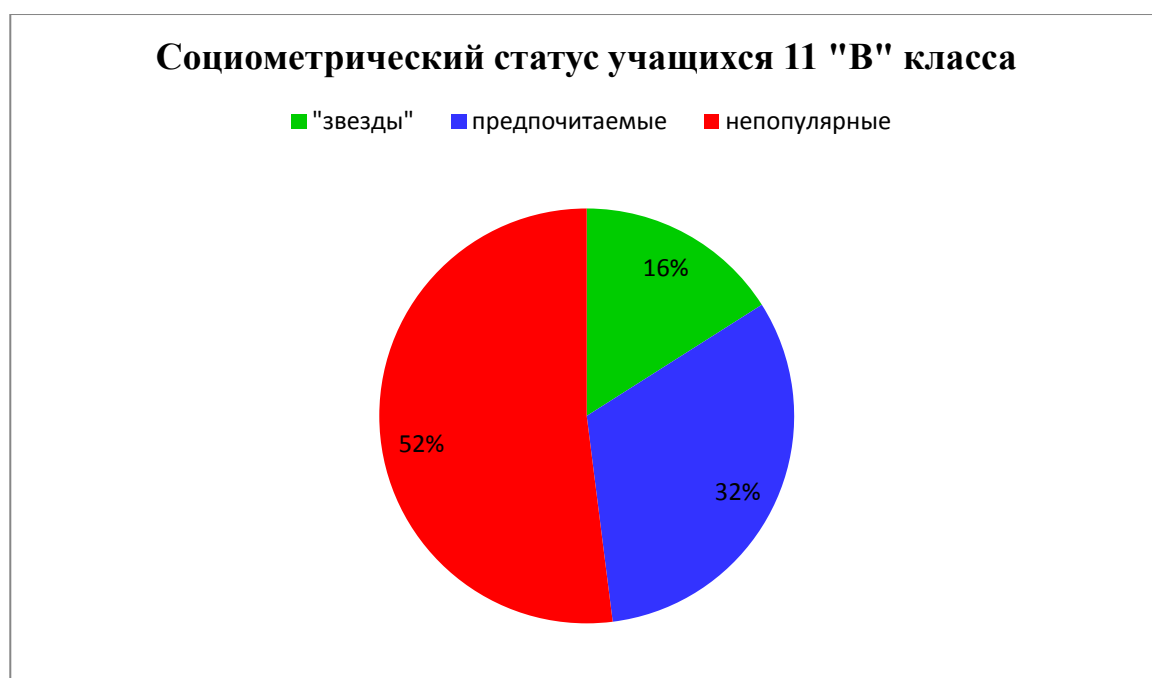
Рис.6. Результаты исследования М. Битяновой «Социометрический метод» в 11«В» классе.

В общем виде данные показатели можно отобразить в виде диаграммы (Рис. 6)