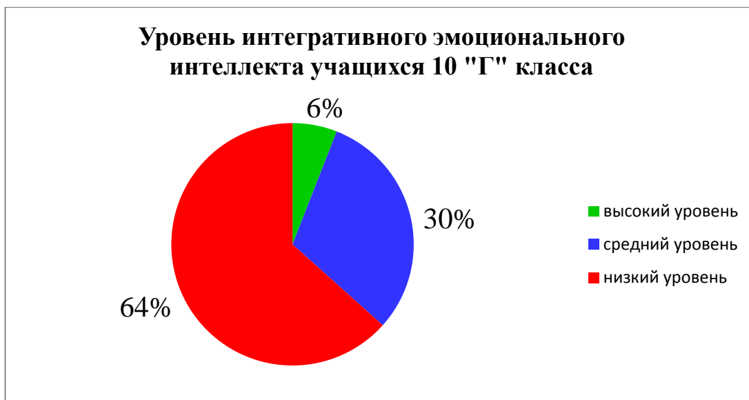
Рис.1 Уровень интегративного эмоционального интеллекта учащихся 10 «Г» класса

Вывод: Результаты диагностики показали, что у 6% учащихся 10 «Г» класса – высокий уровень интегративного эмоционального интеллекта; у 30% - средний уровень; у 64% - низкий уровень интегративного эмоционального интеллекта.