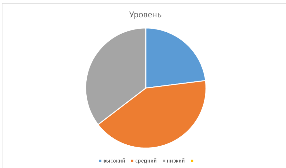
Рис.8. Результаты выполнения задания «Подбери синонимы» в 3Б классе.

Характерными причинами ошибок при выполнении задания учащимися, на наш взгляд, являлись: