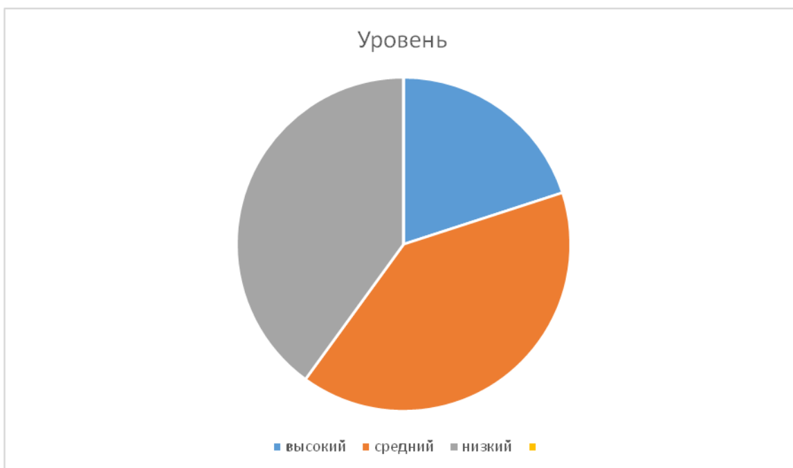
Рис.9. Результаты выполнения задания «Найди синонимы в тексте» в 3Б классе.

Характерными причинами ошибок при выполнении задания учащимися, на наш взгляд, являлись: