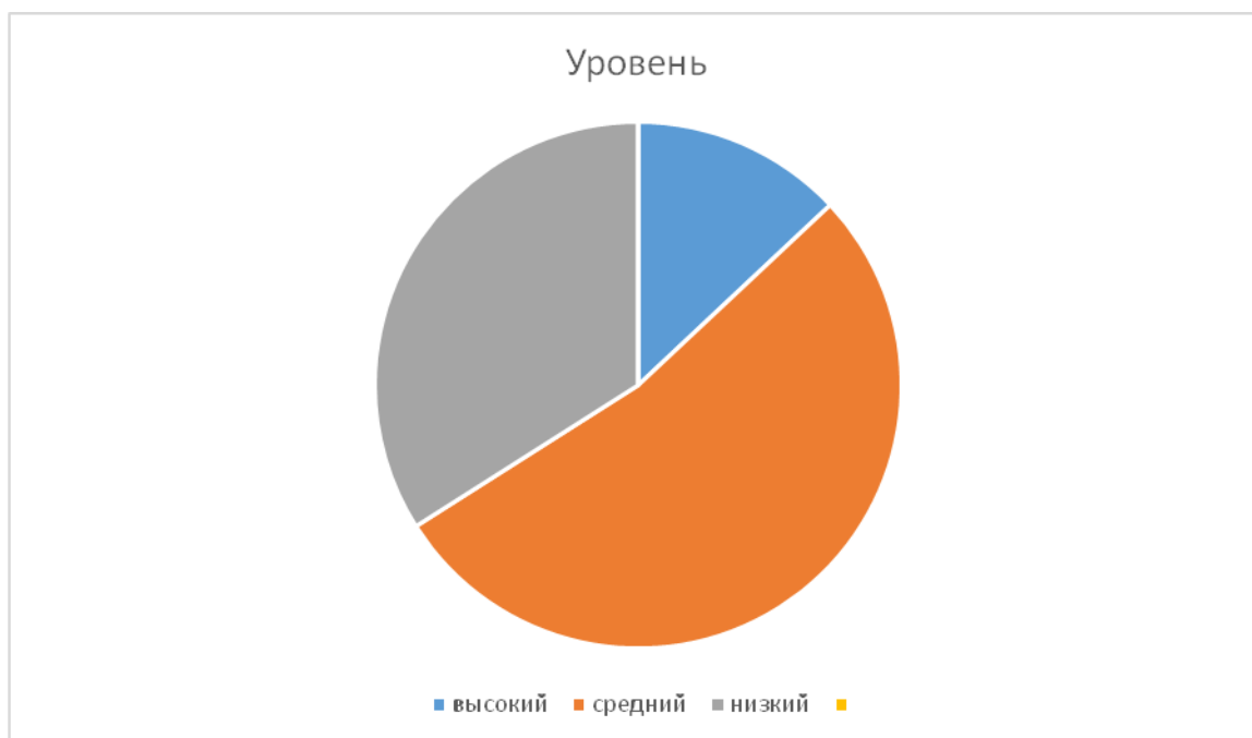
Рис.10. Результаты выполнения задания «Замени выделенные слова в тексте синонимами» в 3Б классе.

Характерными причинами ошибок при выполнении задания учащимися, на наш взгляд, являлись: