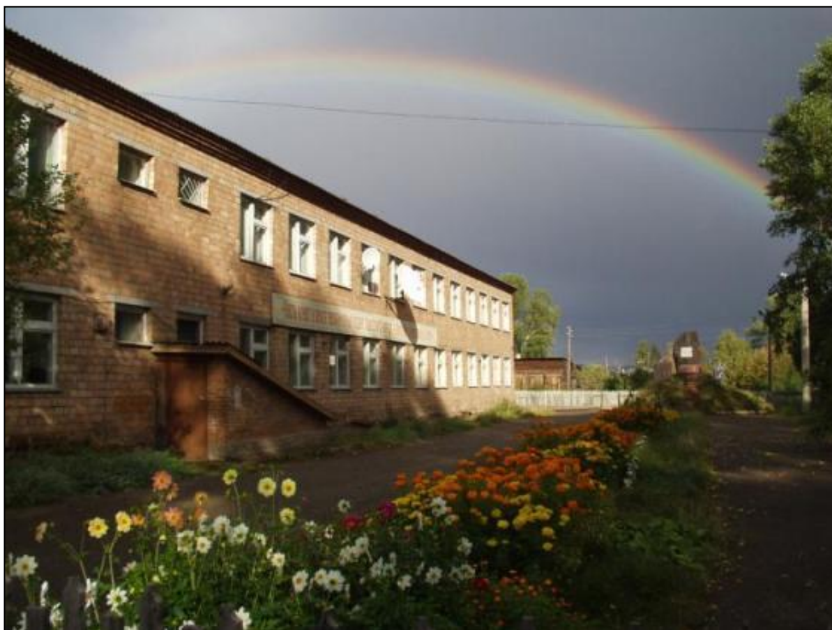
Рис. 5. МКОУ Богучанская школа №1 им. К.И. Безруких, село Богучаны, Красноярского края

уровень технического развития, но мы по-прежнему целиком и полностью зависим от окружающего нас мира живой и не живой природы. Значит, мы должны беречь и приумножать богатства окружающего нас мира. Воспитанию экологической культуры подрастающего поколения, любви к родному краю необходимо уделять повышенное внимание, как в рамках основного, так и дополнительного образования.