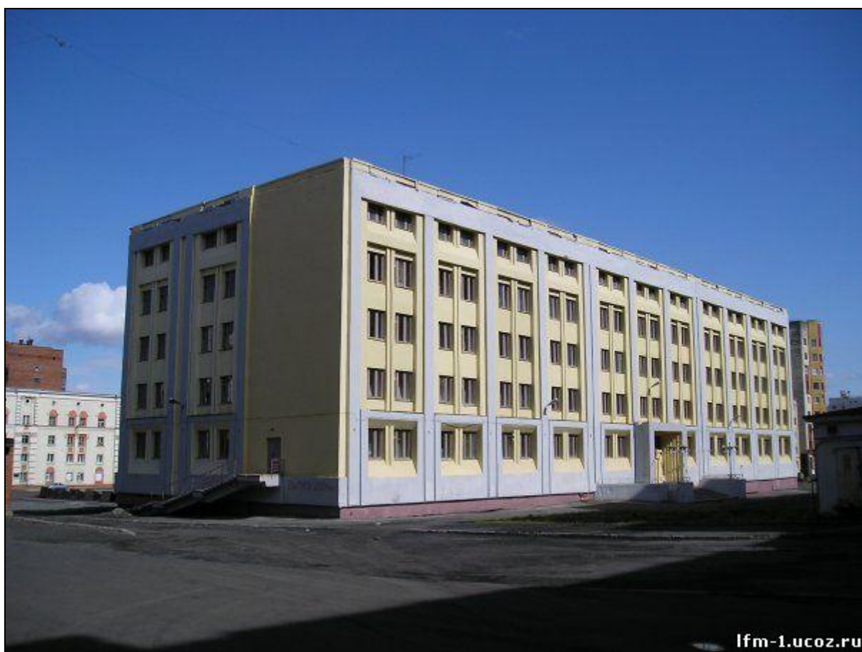
Рис 7. Муниципальное бюджетном общеобразовательном учреждении «Средняя школа № 1 с углубленным изучением физики и математики им. А.П.Завенягина», г. Норильска, Красноярского края

Изучение экологических проблем родного края в Муниципальном бюджетном общеобразовательном учреждении «Средняя школа № 1 с углубленным изучением физики и математики им. А.П.Завенягина», г. Норильска, Красноярского края (рис. 7).