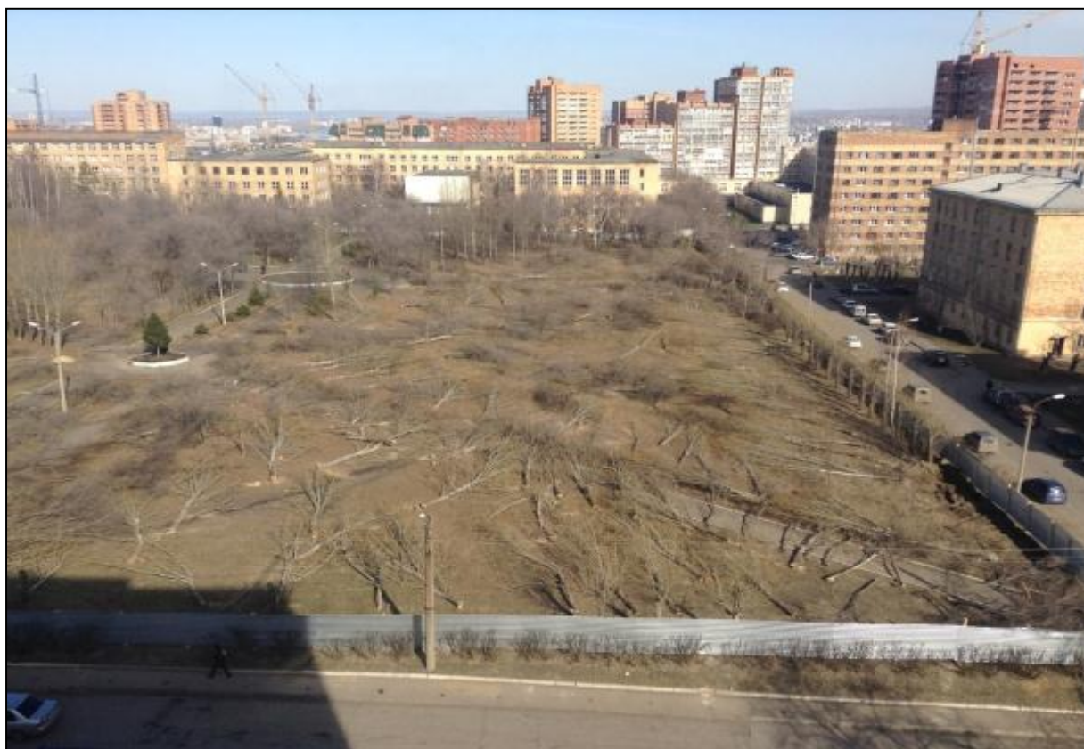
Рис. 3 Вырубленный за одну ночь сквер в Красноярском Студенческом городке.

Серьезной экологической проблемой краевого центра является малое число зеленых насаждений во многих жилых районах города. Особенно страдают жители Центрального и новых микрорайонов Советского районов, а так же всего правого берега. Жители Красноярска обеспокоены вырубкой деревьев в черте города. Стоит упомянуть вырубку сквера в Студенческом городке, её осуществили под покровом темноты – за одну ночь (рис. 3).