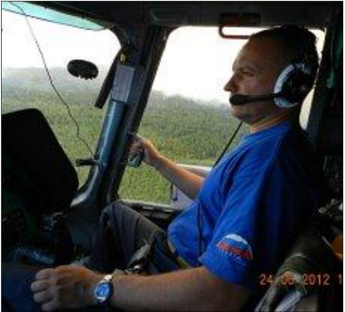
Рис. 4. Пожары 2012 года в Богучанском районе Красноярского края. Вид из кабины вертолѐта.

После обширных пожаров естественное восстановление леса происходит не во всех районах и может растягиваться на годы и даже десятилетия. Так, например, в Богучанском районе Красноярского края до сих пор не восстановились гари после крупных пожаров восьмидесятых годов прошлого века. Для решения этой экологической проблемы необходимо приложить большие усилия. Перед лесоводами края ставится задача – сократить, по возможности, до минимума эти сроки. Так же необходимо на месте пожаров сформировать растительное сообщество с высоким экологическим потенциалом, способное кардинально улучшить природный статус