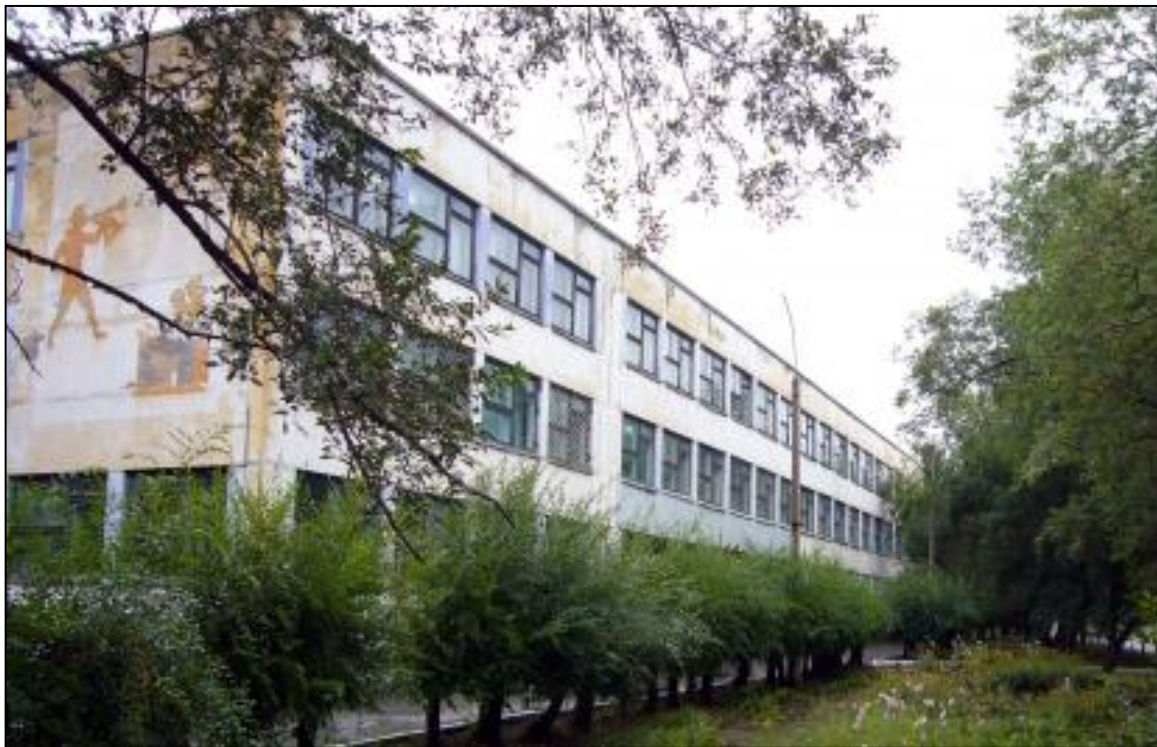
Рис. 6 Муниципальное общеобразовательное бюджетное учреждение "Средняя общеобразовательная школа №2", город Минусинск, Красноярского края.

изучение проблем окружающей среды родного края, имеют довольно сложный и многогранный состав. Для хорошего усвоения материала школьникам требуется плотная взаимосвязь классной и внеклассной работы, а так же поощрение личной инициативы учащихся.