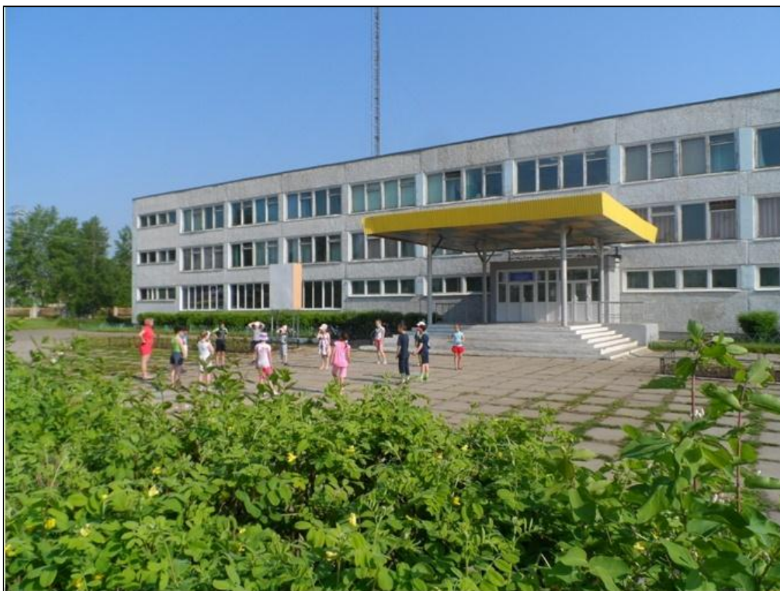
Рис. 8. Муниципальное казенное общеобразовательное учреждение Кодинская средняя общеобразовательная школа № 4, Красноярский край, Кежемский район

Педагогический эксперимент проводился при Муниципальном казенном общеобразовательном учреждении Кодинская средняя общеобразовательная школа № 4, Красноярский край, Кежемский район (рис.8).