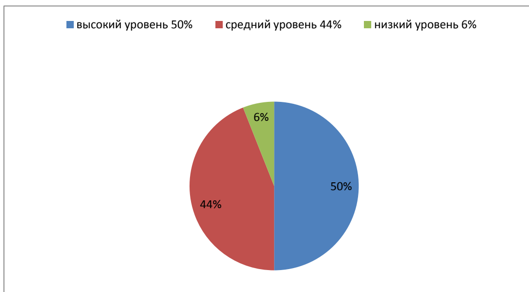
Рис.1. Распределения учеников 3 «Б» класса по уровням.

В гардеробе вы можете и раздеться, и одеться (переодеться, не раздеться).