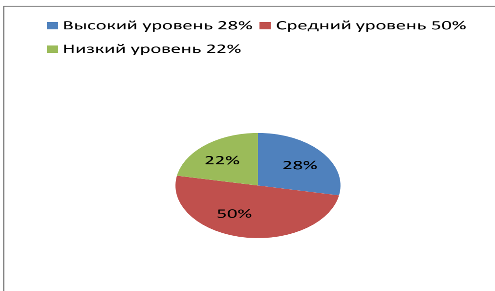
Рис.3.Распределение учеников 3 «Б» класса по уровням.

Итак, на высоком уровне с заданиями справились 28% учеников, на среднем уровне выполнили работу 50% учеников, 22% учеников показали низкий уровень.