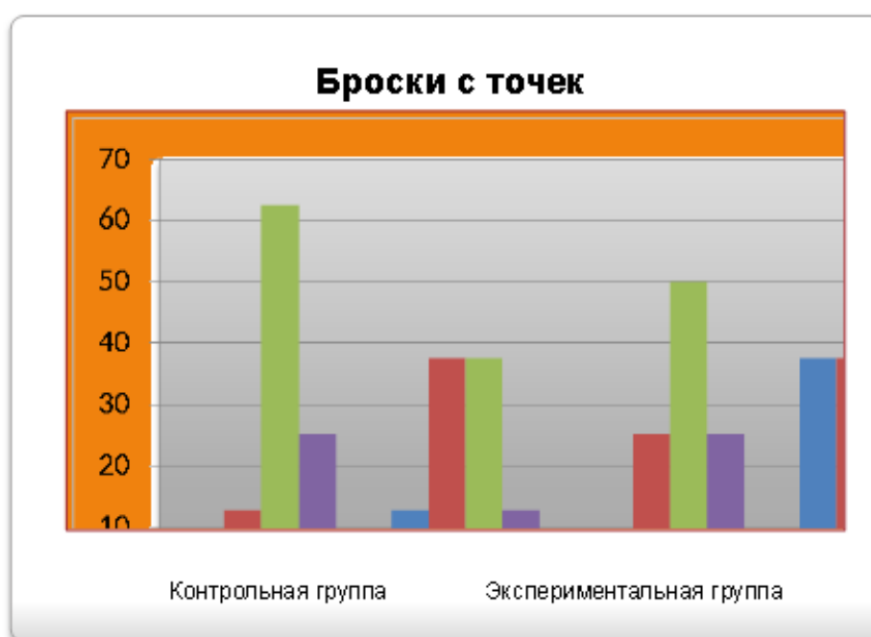
Рисунок 1 – Результаты исследования точности бросков с точек basketболистами 13-14 лет

В результате педагогического эксперимента нами были выявлены следующие результаты исследования техники выполнения бросков у basketболистов 13-14 лет. Результаты, полученные в ходе проведения контрольного испытания «Броски с точек» мы отразили в Приложении 1 и на гистограммах (Рисунок 1).