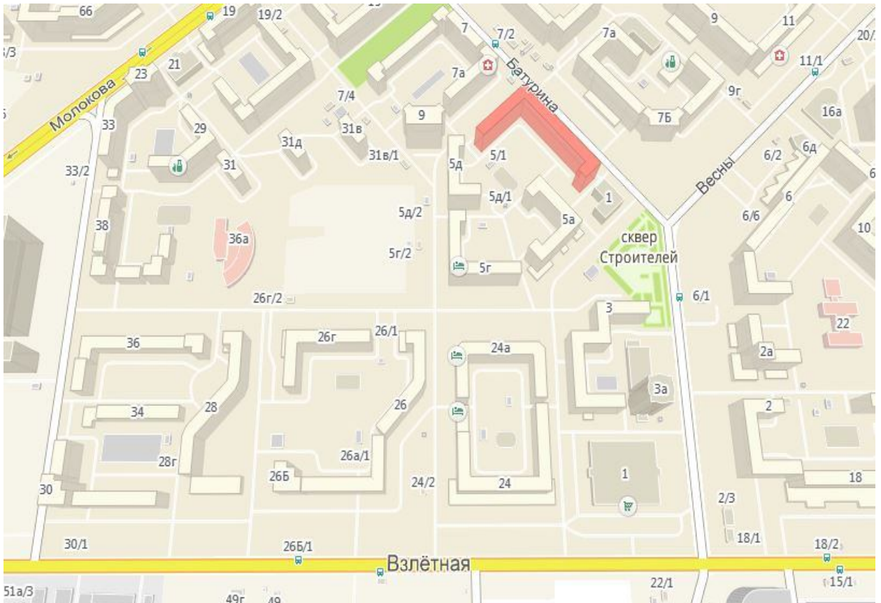
Рис. 2.1. Географическое расположение детского центра развития.

Примерная стоимость помещения составит 8400 тыс. руб. (средняя рыночная стоимость в Советском районе города составляет 42 тыс. руб. за 1м 2 ).