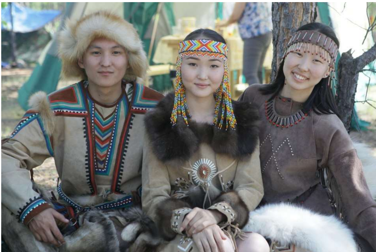
Рис. 8. Эвенки

республик Якутии и Бурятии, Красноярского, Забайкальского и Хабаровского краев. Есть эвенки также в Томской и Тюменской областях. На этой гигантской территории они нигде не составляют большинства населения, живут в одних поселениях вместе с русскими, якутами и другими народами.