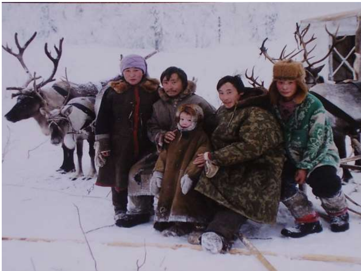
Рис. 9. Кеты

Сибири с древними монголоидами. Примерно в 1 тысячелетии новой эры они вступили в контакты с тюркским и самодийско-угроязычным населением и в результате миграций оказались на Енисейском Севере.