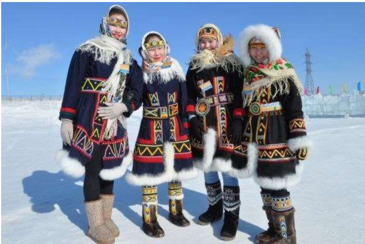
Рис. 4. Долганы

Формирование долган как самостоятельного этноса происходило в сравнительно близкое историческое время — в 19 - начале 20 веков. В этногенезе долган ведущую роль сыграли эвенки. Основу долганского этноса составили четыре эвенкийские родовые группы: долган, донгот, эдян и каранто. Кроме них в состав долган вошли также отдельные группы якутов, энцев, ненцев и русских старожилов, известных на Таймыре под именем «затундренные крестьяне».