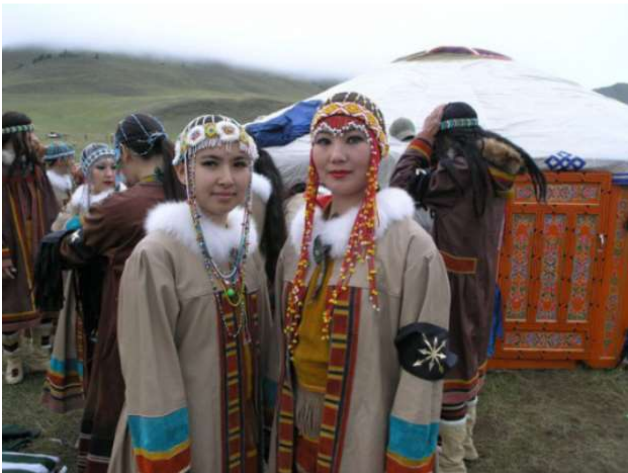
Рис. 11. Чулымцы

Чулымцы (томские карагасы, чулымские люди, чулымские татары, чулымские тюрки, чулымские хакасы) — небольшой тюркский народ Сибири. Название происходит от реки Чулым (приток Оби), в среднем и нижнем течении которой они проживают (рис. 11).