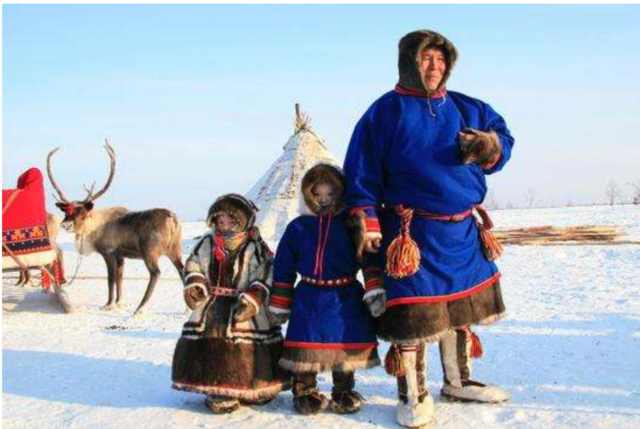
Рис. 7. Энцы

В первой половине XVII в. на северо-востоке Западной Сибири начинается процесс изменения этнической территории энцев, связанный с переселениями селькупов и формированием их северной этнографической группы. К концу XVII в. селькупы окончательно закрепляются в бассейне р.Таз, а в XVIII в., по обеим рекам Баиха. Взаимодействие энцев с селькупами носило различный характер: от прямых военных столкновений, до переселений на новые территории, ближе к низовьям Енисея и вхождения части энецких семей в состав селькупов. Энецкие исторические предания повествуют о военных столкновениях, в этот период времени, между энцами, эвенками и кетами.