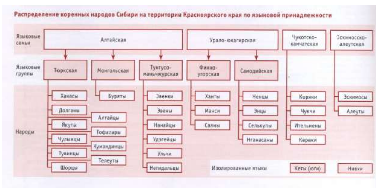
Рис. 1. Лингвистическая классификация коренных народов Сибири [24]

Языковые группы. Языки коренных народов Сибири, проживающих на территории Красноярского края, по принципу родства делятся на несколько языковых семей и групп (рис. 1, приложение 1). Треть из них относится к тюркской группе алтайской языковой семьи — хакасы, якуты, долганы, чулымцы, тувинцы, шорцы, алтайцы, тофалары, кумандинцы, телеуты.