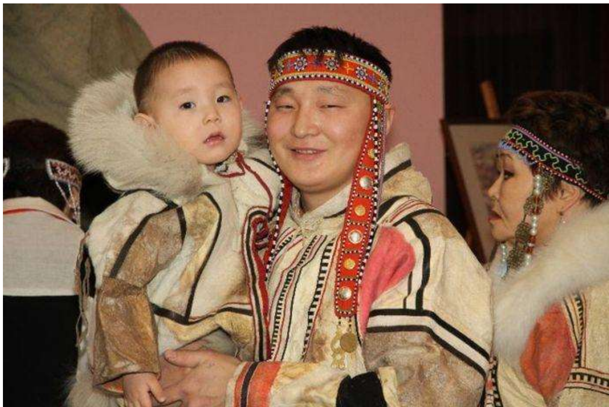
Рис. 6. Нганасаны

(вадеевских). Их соседями на западе являются энцы и ненцы, на востоке и юго-востоке — долганы и якуты. Нганасаны — самый северный народ на Евразийском материке.