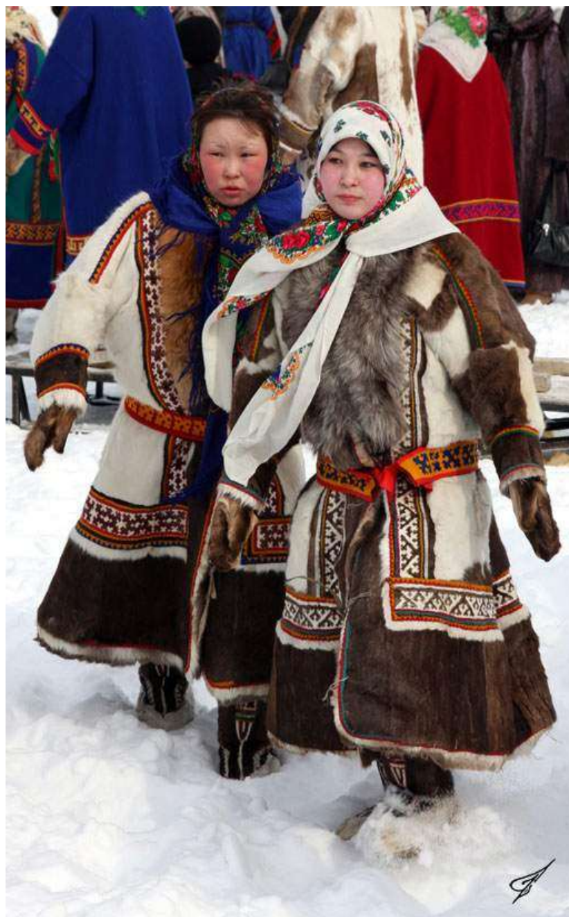
Рис. 5. Ненцы

Происхождение самодийских народов, в том числе и ненцев связывают с кулойской археологической культурой в среднем Приобье. Отсюда в 3-2 веках до н. э. в результате природно-географических и исторических факторов началось постепенное продвижение кулойцев в низовья Оби и среднее Прииртышье. В первых веках новой эры под натиском гуннов часть самодийцев из Прииртышья отступила в лесную зону Европейского Севера, положив начало европейским ненцам. В процессе расселения по северу