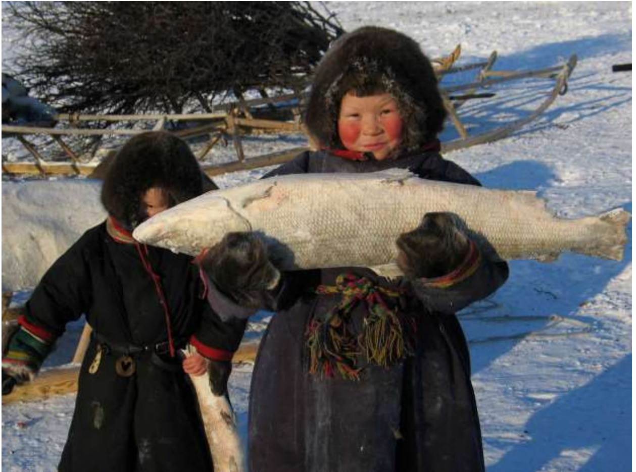
Рис. 10. Селькупы

Прежде всего, это связано с усилением значения оленеводства (как таёжного, так и тундрового), заимствованного у энцев и ненцев, и с переходом на более подвижный образ жизни. Основным типом жилища становится, вместо прежней бревенчатой землянки, переносной чум; основным транспортным средством наряду с традиционной лодкой — нарты. Доминирующие отрасли хозяйства — рыболовство, охота (в том числе охота на пушного зверя). Подсобное значение играет собирательство. Основу пищевого рациона составляют рыба, боровая и водоплавающая дичь. От русских селькупы переняли хлеб, чай, соль, крупы, молоко. Зимняя одежда изготовлялась из шкур зверей, оленей, летняя — из крапивного холста. В XIX в. распространилась покупная одежда, заимствованная у русских.