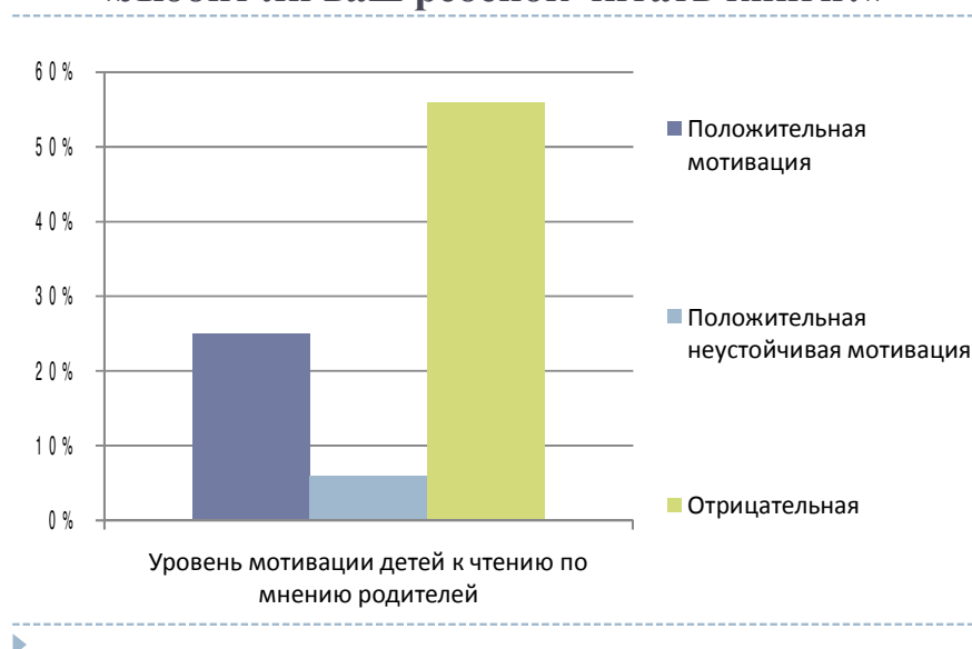
Рис. 3 Результаты анкетирования родителей «Любит ли ваш ребёнок читать книги?»

В общем, получается, что число родителей, представляющих ситуацию в лучшем свете, меньше чем число родителей (12,5%, 2 человека), которые склонны «занижать показатели» и «сгущать краски».