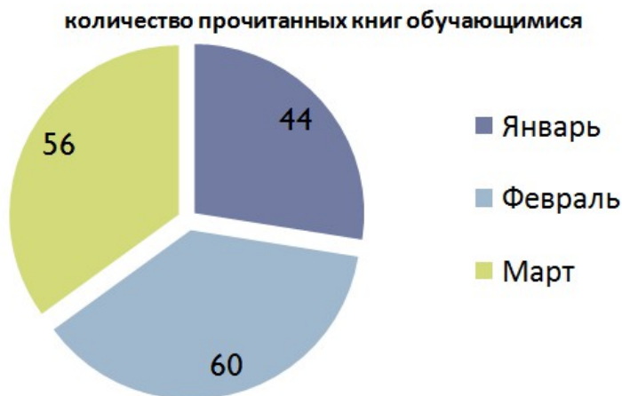
Рис. 1 Результаты трехмесячной акции «Ромашка»

Также в ходе исследования был проведен анализ ежегодной проводимой акции «Ромашка». Каждому ученику было предложено сделать свою ромашку. За каждую прочитанную книгу к ромашке добавлялся лепесток. Чем больше прочитанных книг, тем больше лепестков на ромашке – тем она больше. Итогом этой акции стал праздник, на котором обладатели самых «пушистых» ромашек получили призы. (Рис. 1)