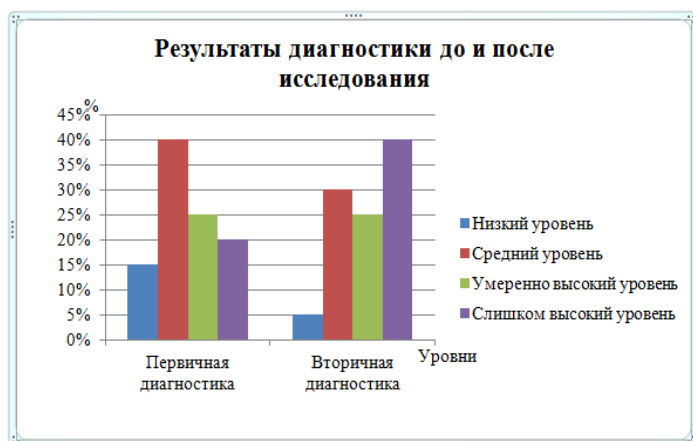
Рис.5 Динамика показателей мотивации достижения успеха (по результатам первичной и повторной диагностики)

средний уровень мотивации к достижению успеха, у 25% – умеренно высокий уровень, у 40% педагогов – слишком высокий уровень, это значит, что большинство из них мотивированы на успех и имеют большие надежды на него, избегая высокого риска. У 5% педагогов был выявлен низкий уровень мотивации к достижению успеха, который препятствует достижению цели.