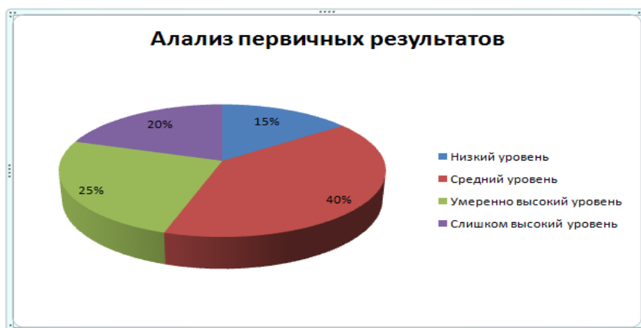
Рис. 2 Анализ первичных результатов по методике «Мотивации к достижению успеха Т. Элерса», показатели в процентном соотношении

Таким образом, преобладает средний уровень мотивации достижения на успех по данной методике у исследуемых педагогов. Процентное соотношение уровней мотивации к достижению успеха в выборке испытуемых представлено на рисунке 2.