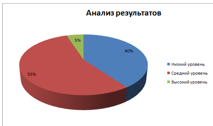
Рис. 1 Анализ первичных результатов по методике «Определение толерантности к неопределенности» (Баднер С.), показатели в процентном соотношении

3. Высокий уровень толерантности к неопределенности (разброс 81-112) показали 5% педагогов. Респондентам данной группы свойственна толерантность и чувствительность к новым, незнакомым ситуациям, сложной, противоречивой информации и проблемам, которые трудно разрешимы.