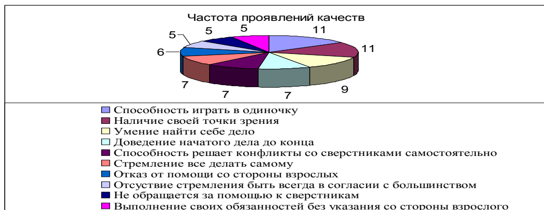
Рис. 2. Частота проявления отдельных качеств, отражающих самостоятельность

Обратим внимание на то, что самостоятельность проявляется через отдельные качества личности. Это видно по рис. 2.