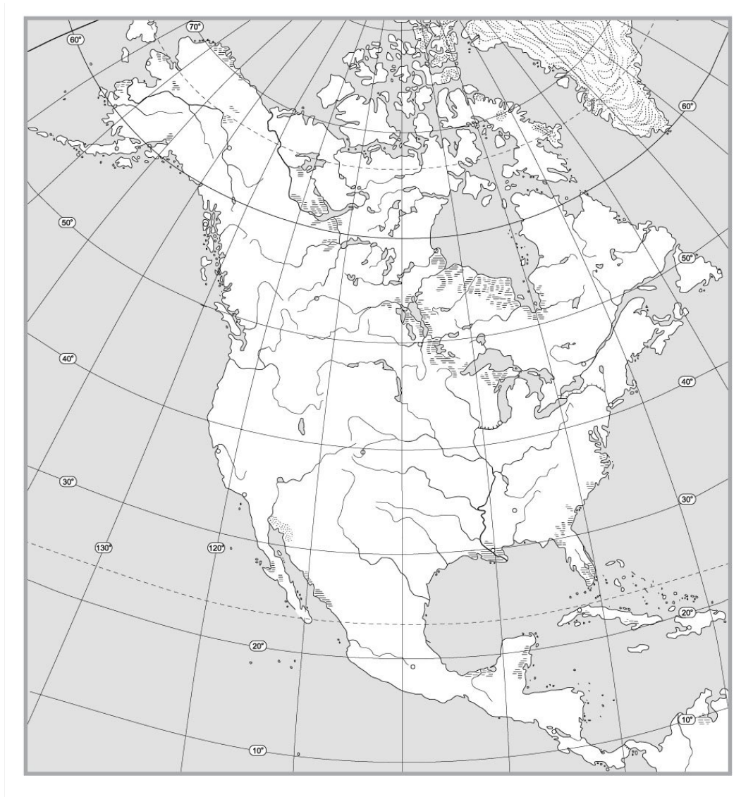
Рис.3 Географическое положение и рельеф Северной Америки