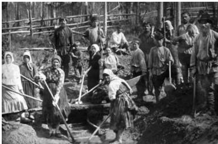
Рис. 4. Артель старателей на золотом прииске. [ 47 ]

Первой наиболее старинной отраслью промышленности Енисейской губернии была золотодобывающая промышленность. Золотая лихорадка охватила не только Сибирь, но и всю Европейскую Россию. Золотопромышленниками стали Трубицкие, Орловы, Кофры, Горчаковы. Сотни тысяч любителей наживы устремились в Южно - Енисейскую тайгу. На рубеже 30 - 40 годов XIX века были открыты месторождения золота и началась его промышленная разработка. В бассейнах рек Пит, Вельмо, Каменка, Малого Шааргана (с притоком Удерей), Рыбная возникали приисковые поселки (рис. 3 и 4). [ 25, 41]