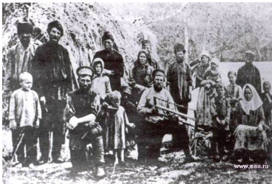
Рисунок 3. Русские переселенцы на Ангаре [ 47 ]

населения, обзаводились семьями. В 1669 г. среди русских в уезде семейные составляли 56,8%, в том числе среди крестьян - 77,1%. В начале XVIII в. в уезде закончилось формирование постоянного русского населения, дальнейший рост его происходил в значительной мере за счет естественного внутреннего развития.(рис. 3).