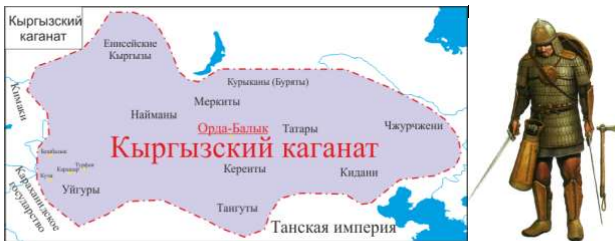
Рисунок 1. Кыргызский каганат на территории Красноярского Приангарья [14]

В V-VI веках н.э. в Красноярском Приангарье возникло первое государство енисейских кыргызов, которые до смешения с хуннами, жившими в степях Монголии, являлись европеоидами. Культура кыргызов оказала большое влияние на жителей северных лесостепей и южной тайги (рис. 1).