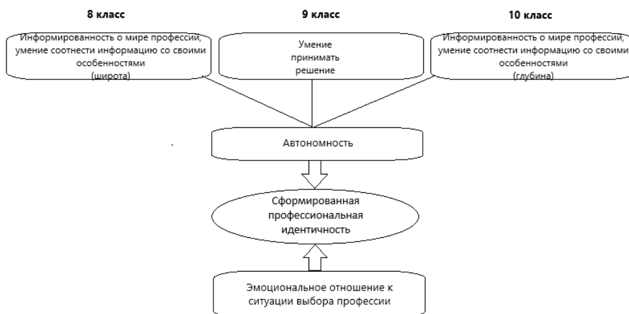
Схема 3. Сопровождение профессионального самоопределения старших подростков

На основе результатов теоретического и эмпирического этапов исследования, сформулированной цели и задач, нами была разработана модель психолого-педагогического сопровождения профессионального самоопределения старших подростков.