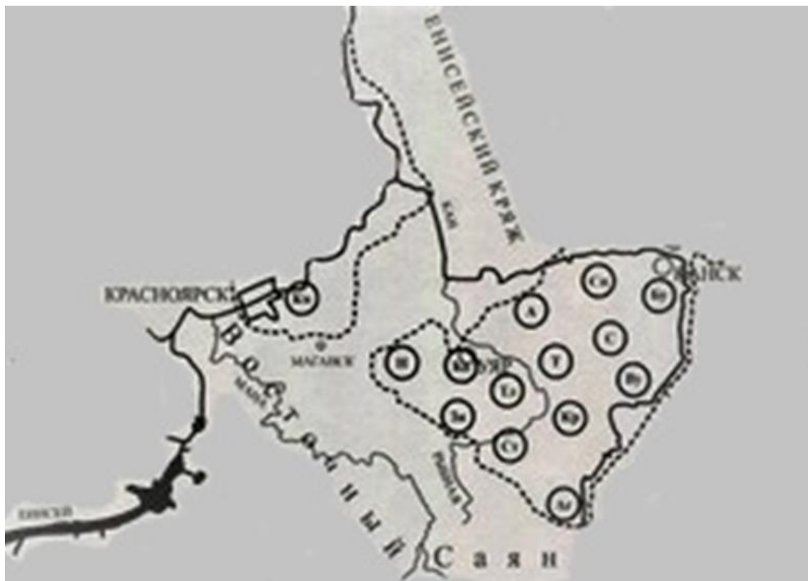
Рисунок 1. Локальные флоры на территории Рыбинского района Красноярского края. Название базовых локальных флор: Канская лесостепь: А – Александровка, С – Солонечное, Т – Татьянаовка, Кр – Красногорьевка, Сп – Спасовка.

Ранее нами был составлен конспект флоры сосудистых растений (Приложение 1). Конспект был составлен по материалам 5 изученных локальных флор (ЛФ), заложенных более или менее равномерно на территории Рыбинского района Красноярского края. (Рис. 1)