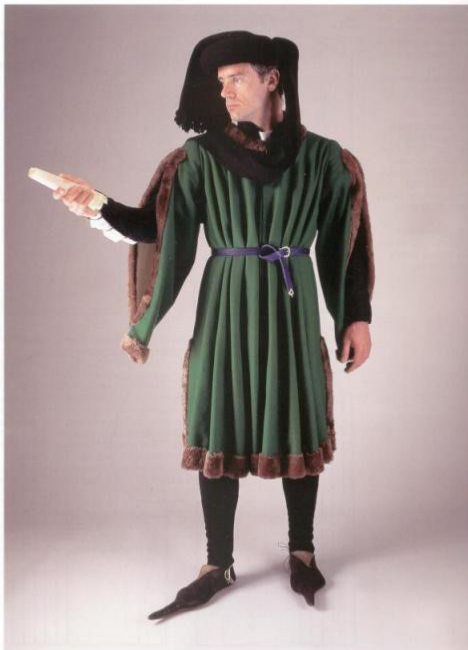
Plate 12 Mid 15th century pleated gown

Gown similar to Fig 18, in good quality woollen cloth with fur edging, showing well-defined pleating. He is wearing a chaperon ( Men's Hoods , Fig 6); the white at the neck is a breast kerchief. The slashed sleeves show off both doublet and shirt.