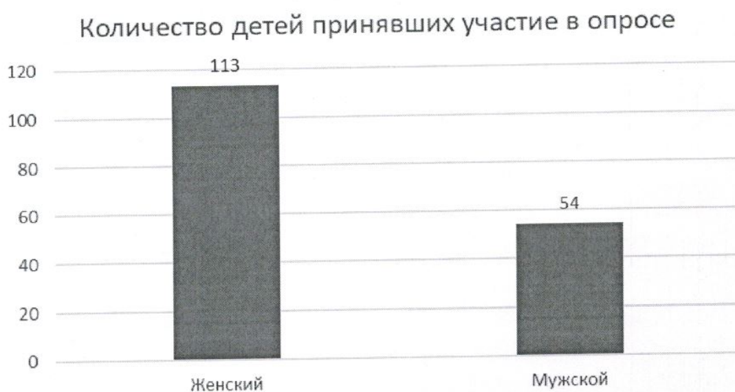
Рисунок 2 - Количество детей принявших участие в опросе

Анализ первого вопроса показал, что всего в опросе приняли участие 167 учащихся из разных школ Края. Это 113 представителей женского пола (или 67.7%) и 54 респондента мужского пола (32.3%). Данные представлены на рисунке 2.