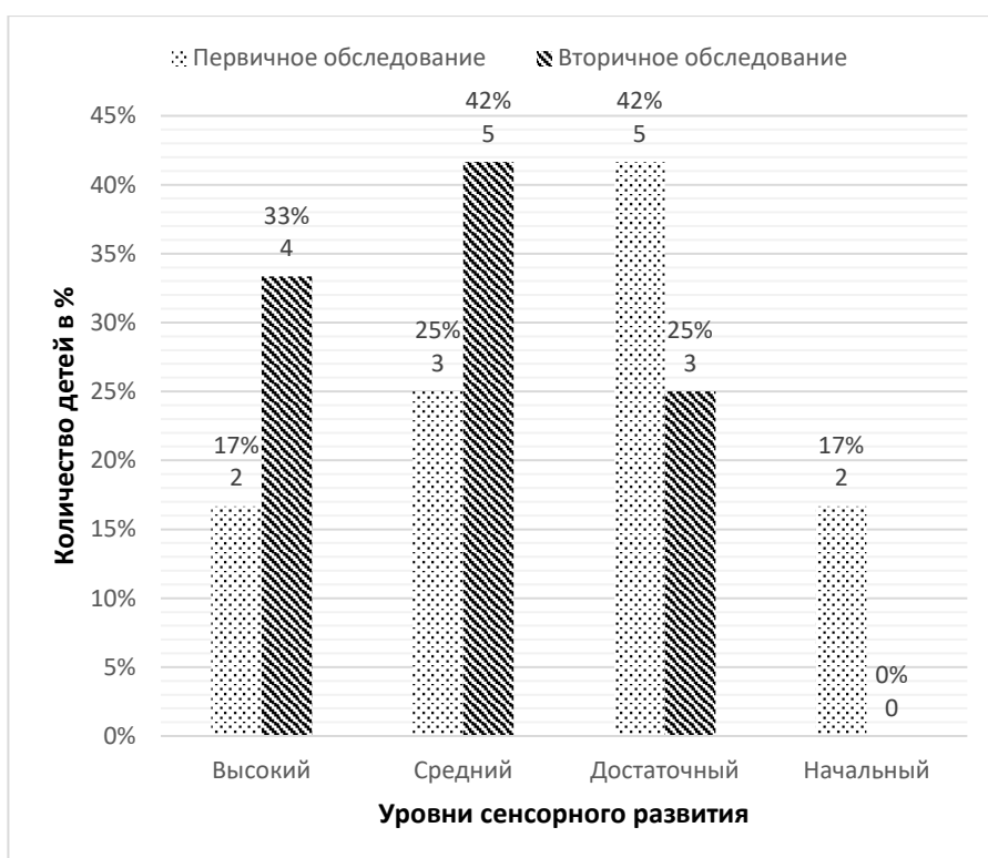
Рисунок 2. Результаты контрольной диагностики уровня сенсорного развития в динамике

Для начала рассмотрим результаты диагностического обследования в экспериментальной группе. Приведем результаты диагностики в динамике. (рисунок 2)