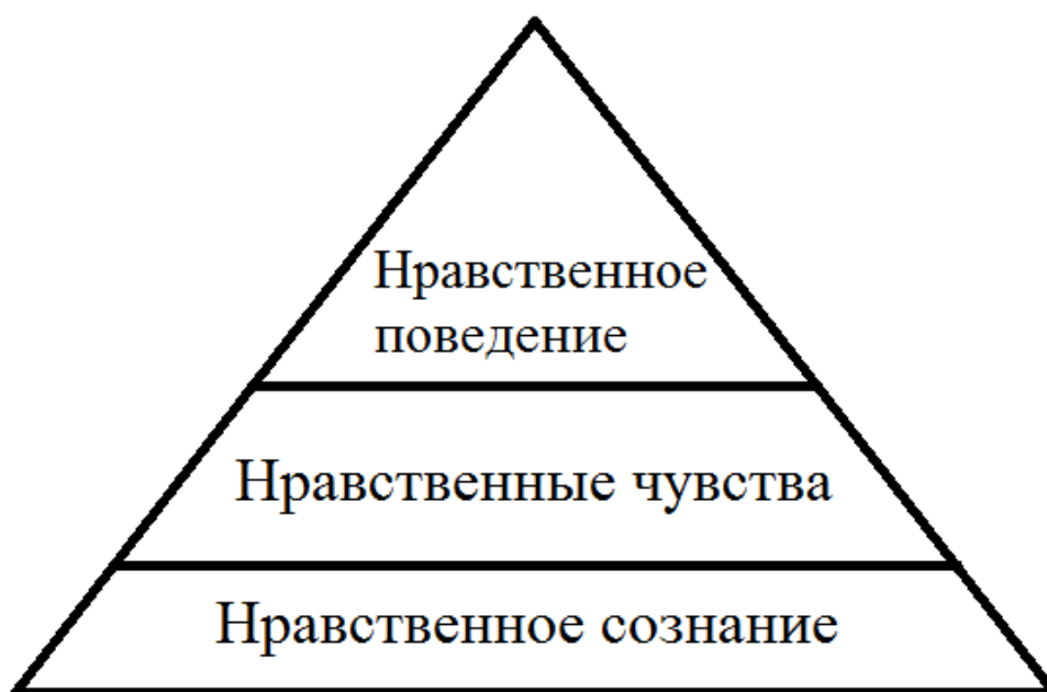
Рисунок 1. Модель структуры элементов нравственной личности

Л.Н. Антилогова, один из ведущих исследователей нравственного сознания, дала следующее определение нравственному сознанию: «...интегративное личностное образование, представленное эмоционально-чувствительной, рациональной и волевой сферами, формирующееся под влиянием внешних (социокультурных) и внутренних (психологических) факторов и проявляющимся в поведении, деятельности и отношении человека с другими людьми» [2].